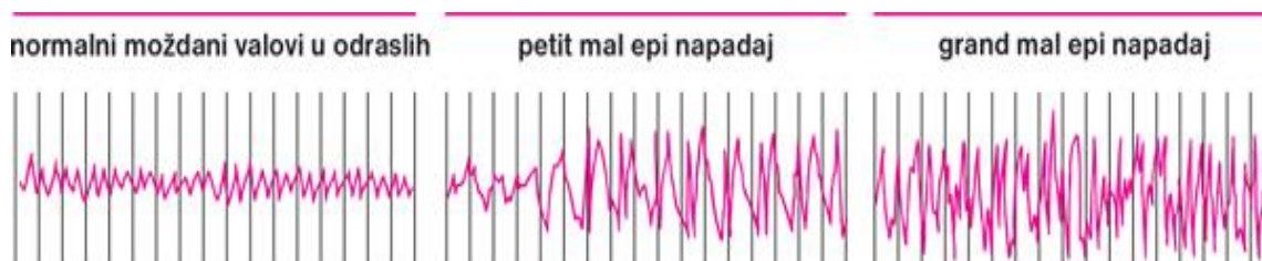
Slika 4.2. Elektroencefalogram (20)