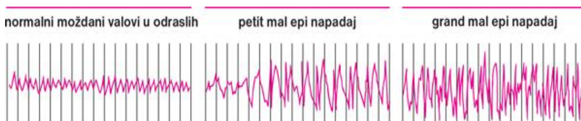
Slika 4.2. Elektroencefalogram (Izvor: http://www.msd-prirucnici.placebo.hr/msd-za-pacijente/bolesti-mozga-i-zivcanog-sustava/poremecaji-s-epilepticnim-napadajem/epilepsija Pristup: 26.5.2023.) (20)