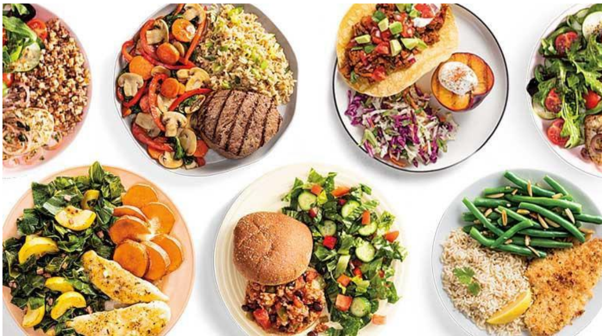
Slika 1. Primjer izgleda tanjura