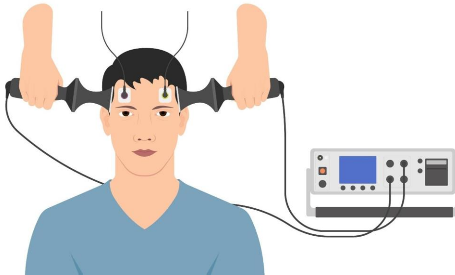
Slika 4.3. Elektrokonvulzivna terapija (30)

Elektrokonvulzivna terapija ili ECT može igrati važnu ulogu u liječenju depresije u starijih osoba (Slika 4.3.) (28). Kad starije osobe ne mogu uzimati tradicionalne lijekove protiv depresije zbog nuspojava ili interakcija s drugim lijekovima, kad je depresija vrlo teška i ometa osnovno svakodnevno funkcioniranje ili kad je rizik od samoubojstva posebno visok, ECT se predlaže kao vrlo često sigurna i učinkovita opcija liječenja.