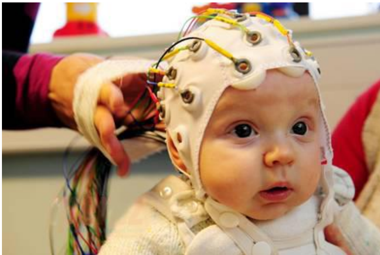
Slika 2. Snimanje EEG-a kod dojenčeta

patoloških stanja poput tumora, poremećaja svijesti i cirkulacije, malformacija itd. kao i u analizi fiziologije spavanja. U pravilu se snima u stanju budnosti uz zatvorene i otvorene oči, ali i u spavanju kako spontano tako i ciljano uz rutinske provocirajuće metode poput fotostimulacije i hiperventilacije. Nalaz čak i kod postavljene dijagnoze epilepsije može biti normalan ako se snima izvan epileptičkog napada, dok sniman u vrijeme napada uvijek bude abnormalan, ali je moguća i abnormalnost u zdravog čovjeka, osobito djece. Konačan izgled EEG-a određen kao normalan doseže se u pubertetu, dok se rastom i razvojem djeteta on mijenja uz široka odstupanja (1).