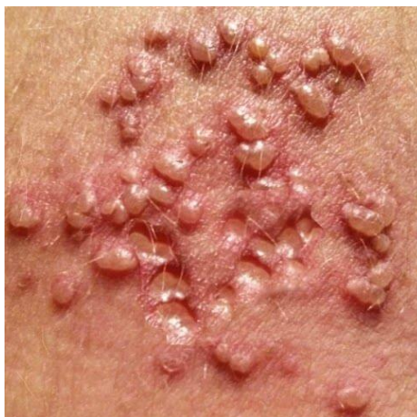
Slika 5.1. Genitalni herpes

Komplikacija koju može izazvati herpes virus i koja najviše zabrinjava jest prijenos virusa s majke na fetus (16).