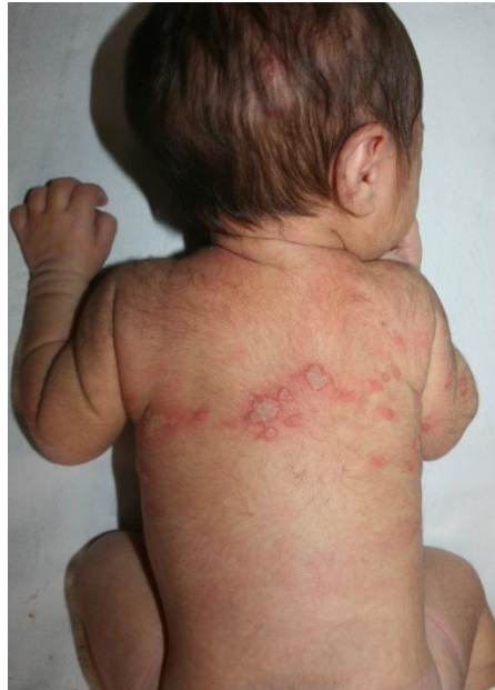
Slika 6.1. Neonatalni herpes

partnere koji su pozitivni pa im treba preporučiti uporabu kondoma ili apstinencije tijekom trudnoće (24).