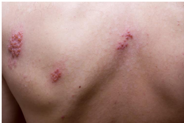
Slika 4.4. Herpes zoster