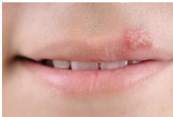
Slika 4.2. Herpes labialis