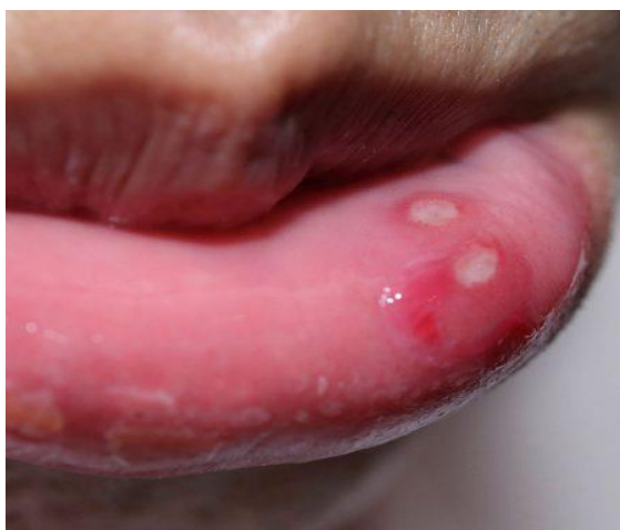
Slika 4.1. Gingivostomatitis herpetica

Herpes simplex virus-1 najčešće se prenosi oralno-oralnim putem odnosno slinom, te uobičajenim socijalnim kontaktom, međutim moguće ga je prenijeti i spolnim putem. Promjene koje se događaju dijele se na primarne koje se odnose na samu infekciju, te rekurentne odnosno ponovnu reaktivaciju virusa koji se nalazi u ganglijima (6). Primarne infekcije kod djece mlađe od 5 godina najčešće prolaze bez simptoma (7). Gingivostomatitis herpetica (Slika 4.1.) kako se naziva primarna infekcija nakon koje ili dolazi do izlječenja ili razvoja rekurentnog oblika infekcije (6). Primarna infekcija praćena je povišenom tjelesnom temperaturom, grloboljom, pojačanom salivacijom, te dolazi do pojave vezikula na bukalnim sluznicama, ždrijelu, hiperemičnim i vulnerabilnim sluznicama gingiva, te na mekom nepcu u usnoj šupljini, vezikule vrlo brzo maceriraju i dolazi do njihovog pucanja (7). Nakon brze erozije vezikula ostaju nakupine malih bolnih erozija (6). Kada govorimo o rekurentnoj infekciji onda se najčešće radi o herpesu labialisu (4.2.). Puno češće se nalazi na donjoj nego na gornjoj usni, bolne vezikule izbijaju te se nakon 48 sati pretvaraju u kruste. Za spontano izlječenje je potrebno od sedam do deset dan. Vrlo rijetko se vezikule pojavljuju unutar usne šupljine, na obrazima, nosu, konjuktivama i rožnici (7).