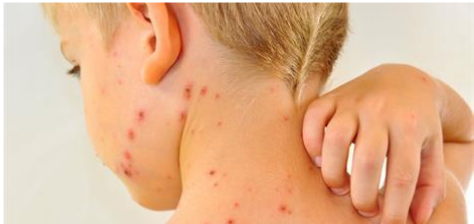
Slika 4.3. Varicella herpes virus

virusa varicelle, odnosno njegovog recidiva. Nekoliko dana prije izbijanja postoji prodromalni stadij u kojem dolazi do lošeg osjećanja, umora, lagano povišene temperature, parestezija, neuralgičnih bolova, osjećaja pečenja (12). Kao prodromalni simptom u 75% slučajeva pojavljuje se bol u zahvaćenom dermatomu. Promjene se najčešće nalaze na jednom dermatomu najčešće torakalni ili lumbalni (11). Ponekad prodroma nema pa kao prvi znak bolesti vidi se crvenilo određenog područja kože, na njima se vide grupe diseminiranih papula koje se ubrzo pretvaraju u vezikule i pustule. Iako je ovakva infekcija u pravilu jednostrana, može se pojaviti i bilateralno, tada govorimo o zoster duplexu (12).