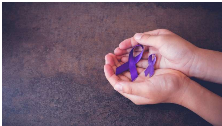
Slika 5.1. Simbol epilepsije

Svjetski dan podrške oboljelima od epilepsije obilježava se 26. ožujka. Taj dan je poznat još kao Purple day , u prijevodu Ljubičasti dan . Ljubičasta boja je boja kojom se obilježavaju oboljeli od epilepsije dok je simbol epilepsije ljubičasta vrpca (Sl. 5.1.).