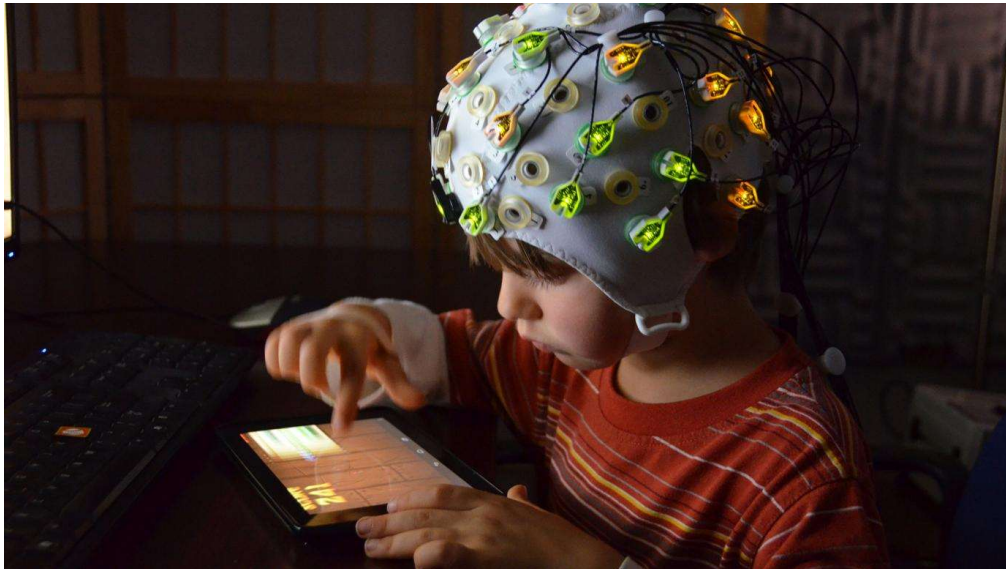
Slika 8.1. Elektroencefalografija