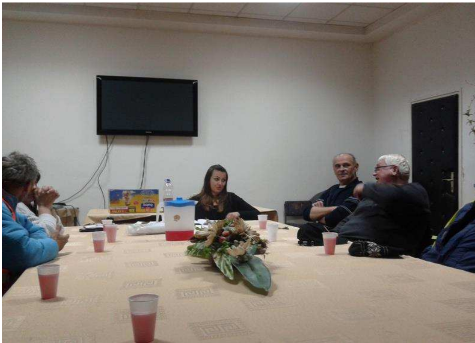
Slika 5. Sastanak terapijske zajednice UKLA Virovitica

Vrlo je bitno istaknuti kako teme o recidivima i aktualni recidivi imaju prioritet, prilikom kojeg se organizira patronažni posjet alkoholičaru recidivistu (7,13,15,16).