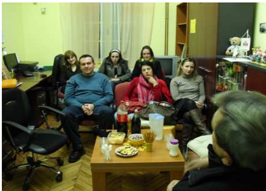
Slika 6. Stručna rasprava na temu alkoholizma u udruzi Veranda

Za uspješnu resocijalizaciju kao i za samu apstinenciju uz redovito sudjelovanje na terapijskoj zajednici vrlo je bitno sudjelovati u izvanklupskim aktivnostima. U nastojanju da pomognu alkoholičarima koji još uvijek pate, Klubovi liječenih alkoholičara imaju zadaću održavati stalnu vezu otvorene i dvosmjerne suradnje s drugim ustanovama, organizacijama i udrugama. Mnogi klubovi organiziraju izvanklupske aktivnosti u kojima se održavaju društvene, zabavne, odgojne i obrazovne aktivnosti uključujući odlaske na izlete, međusobno posjećivanje članova kluba, odlazak na stručne sastanke, večeri poezije, sportske susrete ili memorijalne turnire. Kako bi zajednica bila što bolje upoznata s postojanjem i radom kluba najbolje je da ju izvijeste sami članovi kroz kontinuirane, periodične posjete i događanja. Izvanklupska druženja pridonose bržem stvaranju uvida u svoje poteškoće, a samim time i s čvršćom i kvalitetnijom apstinencijom. Nije da se samo jača pojedinac, već i cijela grupa (18).