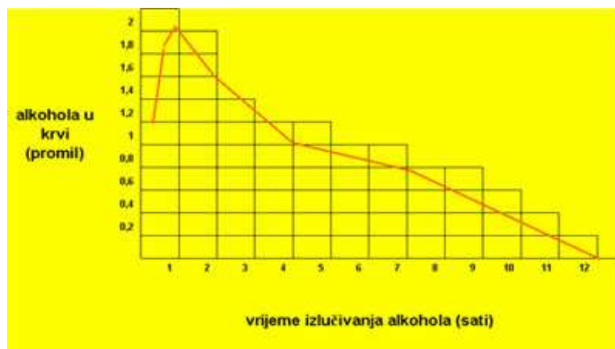
Slika 1. Vrijeme izlučivanja alkohola u promilima po satu

U jetri se alkohol razgrađuje brzinom od 8 do 10 grama, što znači u prosjeku 0,1‰ koncentracije u krvi na sat. Jetra relativno polako razgrađuje alkohol, pa veća količina popijenog alkohola dolazi u krvotok i izaziva simptome alkoholne intoksikacije. ‰ koncentracije alkohola u krvi (8).