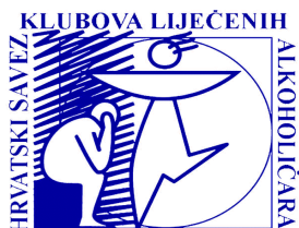
Slika 4. Logo HSKLA

Klubovi imaju svoje koordinativno krovno tijelo – Hrvatski savez klubova liječenih alkoholičara (HSKLA) koje je osnovano 1965. u Zagrebu. Danas HSKLA evidentira da na području Hrvatske djeluje 179 klubova od čega je na području Zagreb 79 klubova (16). Danas osim u Hrvatskoj i Italiji Klubovi liječenih alkoholičara djeluju i u mnogim drugim europskim zemljama (Rusija, Bugarska, Portugal, Grčka, Poljska, Švedska, Švicarska...) i na ostalim kontinentima (16).