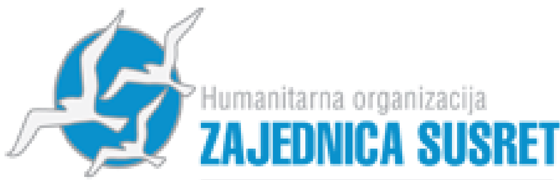
Slika 4.6. Logo humanitarne organizacije zajednice susret Dostupno na: https://www.zajednica-susret.hr/ (12.06.2022.)