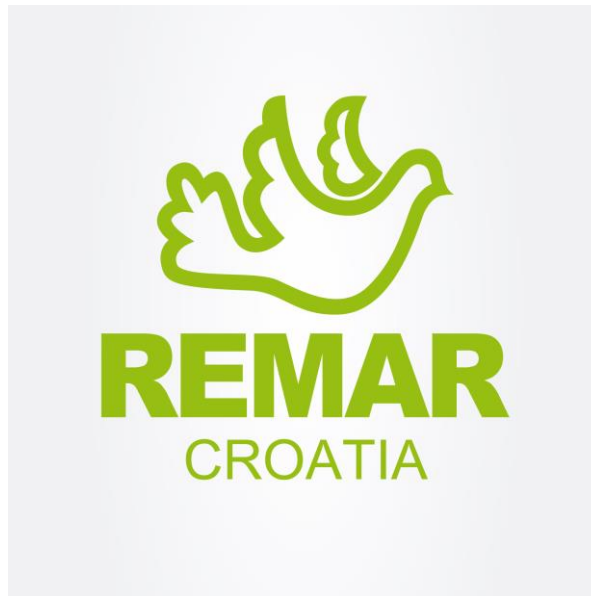
Slika 4.5. Logo Remar zajednice