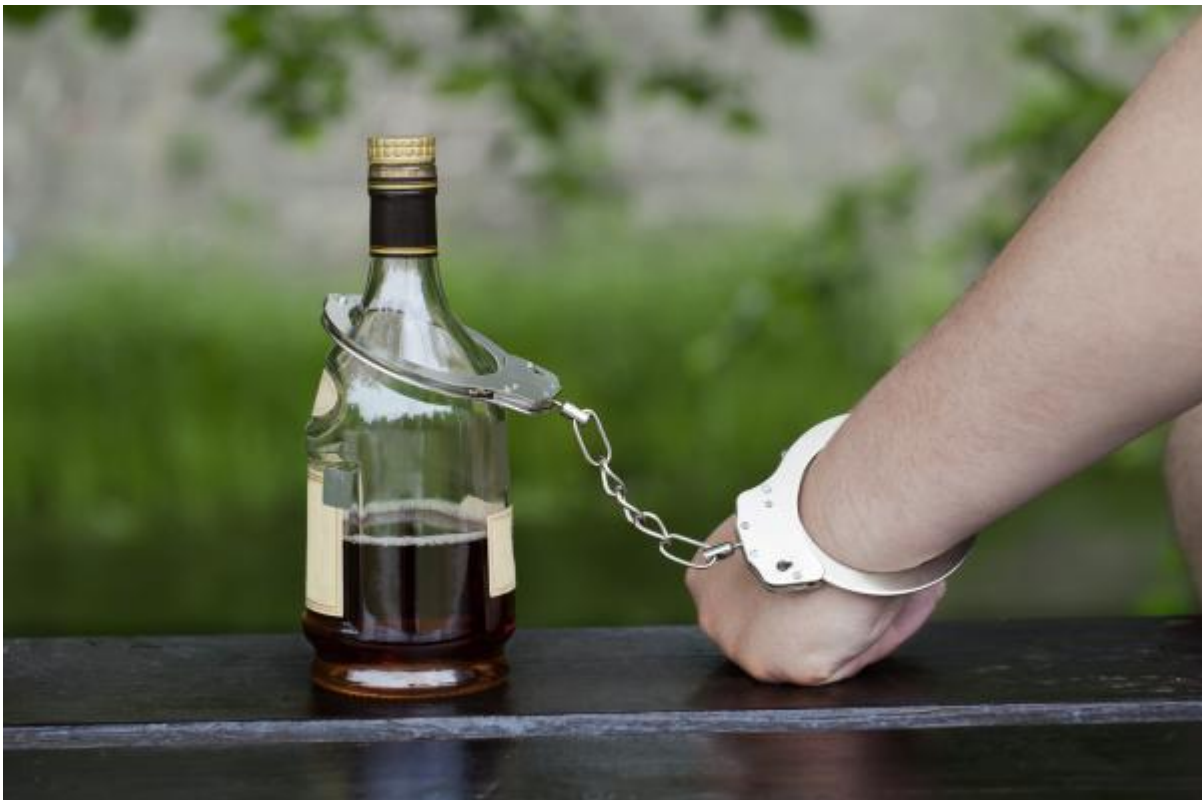
Slika 4.1. Ovisnost o alkoholu

infarkta miokarda, a kod konzumenata alkohola povećana je i incidencija karcinoma glave, vrata, jednjaka, želuca, jetre, kolona i pluća“ (4). Akutna intoksikacija je prolazno stanje, a nastaje konzumiranjem alkohola ili neke druge psihoaktivne tvari, a očituje se smetnjama kognicije, percepcije, razine svijesti, ponašanja ili drugih psihofizioloških funkcija. Pripitost ili laka opijenost je stanje do 0.5 promila alkohola u krvi. Obilježava je pričljivost, blaža euforija, smanjenje kritičnosti uz još prisutnu kontrolu ponašanja i reagiranja. Pripitost prati povećan smijeh i povjerljivost. Nije prisutna amnezija. Teško pijano stanje jest iznad 2.5 promila alkohola u krvi. Obilježavamo ju dezorijentacijom, smetnjama svijesti, pogrešno prepoznavanje, uzbuđenje, nemotiviranim strahom. Amnezija je prisutna, ali može se naći fragmenti sjećanja. Dugotrajnim i prekomjernim konzumiranjem alkoholnih pića dolazi do fizičke i psihičke ovisnosti. Psihička ovisnost je obilježena gubitkom kontrole nad konzumiranjem alkoholnih pića, a fizička ovisnost obilježena je nemogućnosti apstinencije.