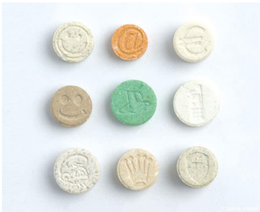
Slika 4.3. Tablete ecstasy-a