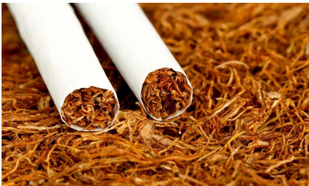
Slika 4.4. Prikaz duhana za konzumiranje

malignih i drugih bolesti s obzirom na štetnost udisaja dima iz cigarete. Prema procjenama SZO-a, u svijetu ima jedna milijarda i tri stotine milijuna pušača. Istraživanja su pokazala da 80 i 100 tisuća djece u svijetu u dobi od 13 do 15 godina puši. U svijetu jedna od deset osoba umre od posljedice pušenja, pa tako više ljudi umire od posljedice pušenja nego od posljedica prometnih nesreća, alkohola, požara, ubojstava, samoubojstava i AIDS-a zajedno. Nikotinomanija je bolest ovisnosti o pušenju duhana. Svjetska zdravstvena organizacija procjenjuje da su 90-95 % ljudi umrlih od raka pluća bili pušači, a kod smrtnosti od ostalih vrsta raka pušača je do 50 %. U smrtnostima od kronične opstruktivne bolesti pluća, emfizema i bronhitisa pušači sudjeluju sa 75-80 %, a kod srčano žilnih bolesti s 20-25 %.