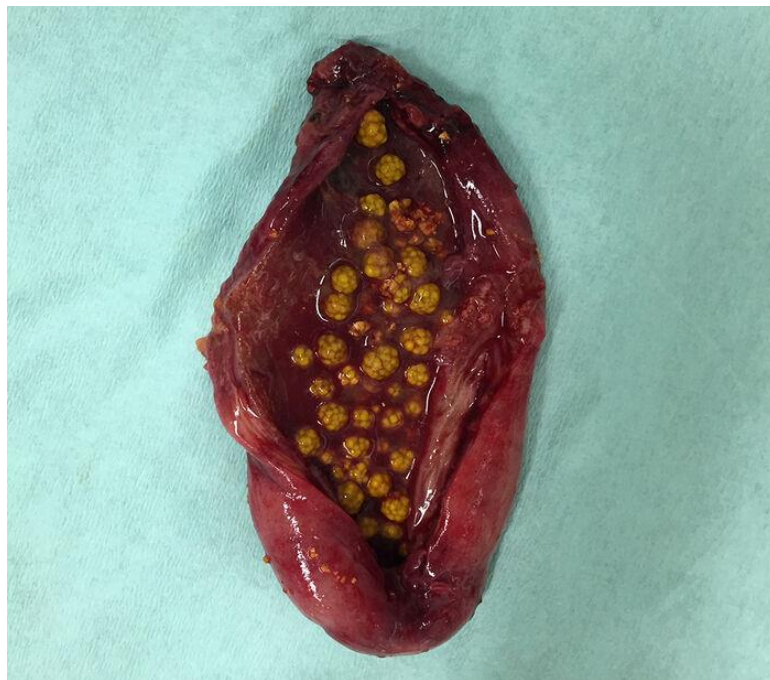
Slika 1.1. Prikaz žučnih kamenaca u žučnom mjehuru (Datum pristupanja: 12.3.2022.)

Nagli gubitak tjelesne težine u kratkom vremenu može povećati rizik za razvoj žučnih kamenaca. Većina žučnih kamenaca stvara se od kolesterola koji nastaje apsorpcijom iz hrane. Proces nastanak kolesterolskih kamenaca uzrokovan je čimbenicima kojima nastaje neravnoteža u količini kolesterola u žuči što uzrokuje formiranje i taloženje kristala. Stvaranje kolesterola u velikoj je mjeri i genetski uvjetovano. Smanjena pokretljivost žučnog mjehura doprinosi nastajanju kamenca te stanje u kojem jetra luči previše kolesterola uzrokujući zasićenost žuči te taloženje žučnih kamenaca (7).