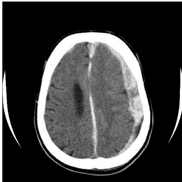
Slika 4.3. CT snimka subduralnog krvarenja

Subduralno krvarenje nastaje između tvrde moždane ovojnice i površine mozga. Najčešći je izvor krvarenja oštećenje tzv. mosne vene, no krvarenje može biti i arterijsko, te je u tom slučaju prisutno oštećenje kortikalne arterije povezano s postojećom kontuzijom mozga. Razlikujemo akutni i kronični subduralni hematoma. Akutni subduralni hematoma klinički se očituje unutar 24 do 48 sati. Stanje svijesti bolesnika može biti u rasponu od kome (GCS < 8) do blažeg poremećaja stanja svijesti. Prisutni su i simptomi povišena intrakranijalnoga tlaka (glavobolja, povraćanje) i neurološki ispadi ( proširenje zjenica, hemipareza). Na slici 4.3. prikazana je CT snimka subduralnog hematoma.