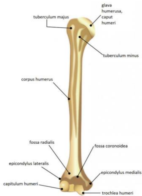
Slika 3.1. Anatomija nadlaktične kosti