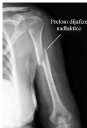
Slika 5.1. Prijelom dijafize nadlaktične kosti

Izravni udarac obično uzrokuje prijelome koji se javljaju u području srednje trećine nadlaktične kosti. Ti se prijelomi klasificiraju na temelju njihova mjesta, statusa otvorenog ili zatvorenog prijeloma i vrsti linije prijeloma. Slika 5.1. prikazuje prijelom dijafize nadlaktične kosti. Većina prijeloma dijafize humerusa liječi se imobilizacijom i rehabilitacijom, odnosno nekirurški. Prijelomi su najčešće posljedica traume, poput pada, automobilskih nesreća ili nesreća na motocikla. U starijih osoba može se dogoditi i pri padu na ispruženu ruku, gdje humerus preuzima teret ozljede umjesto zgloba. Vrhunac incidencije javlja se kod muškaraca u dobi od 21 do 30 godina i kod žena u dobi od 60 do 80 godina, iako se prijelom humerusa može dogoditi kod osoba bilo koje dobi ili spola (9).