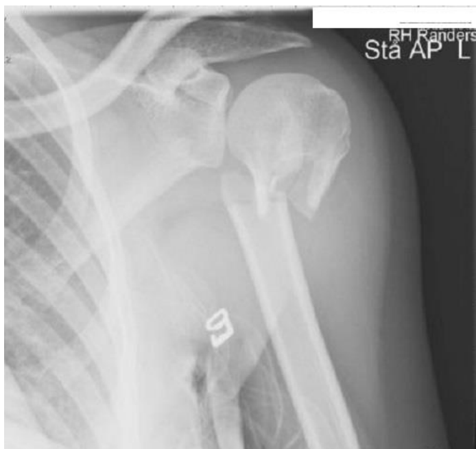
Slika 5.1. Prijelom proksimalnog dijela humerusa