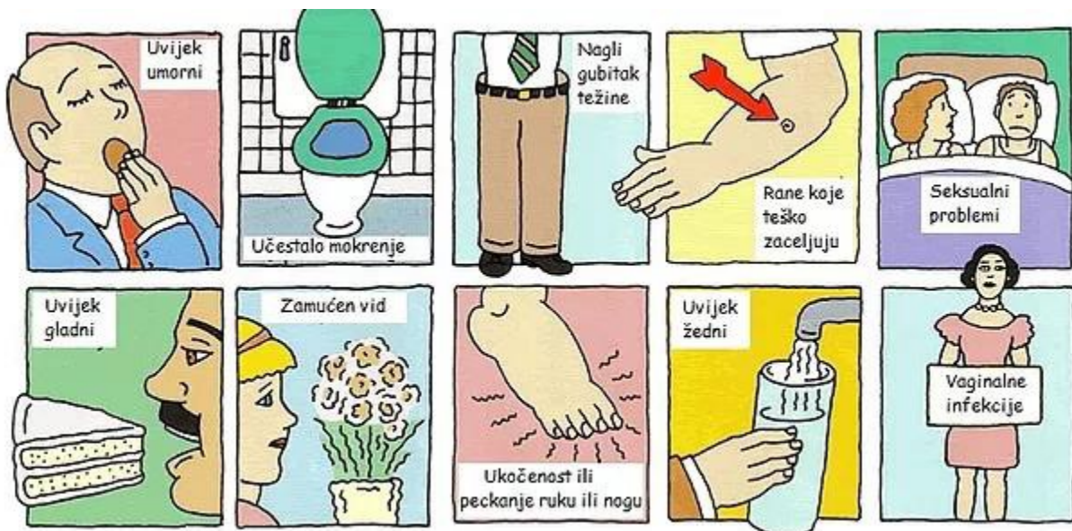
Slika 5.1. Simptomi šećerne bolesti ( https://diabetlifenvo.wixsite.com , 22.1.2021.)

U težim slučajevima također je prisutna glikozurija 3 i povišena je koncentracija glukoze u krvi, ponekad je prisutan i aceton u mokraći i ketoni u krvi, a u stanjima ketoacidoze dehidriranost, plitko ubrzano disanje, sniženi pH krvi i bikarbonati te karakterističan miris po acetonu. Kako uočiti simptome dijabetesa prikazano je na slici 5.1. (2,3)