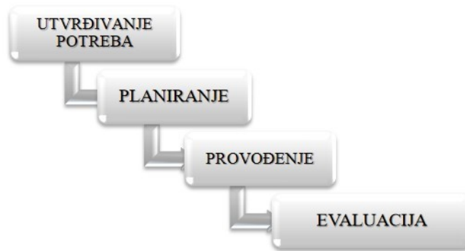
Slika 9.1. Faze procesa zdravstvene njege ( https://repo.ozs.unist.hr , 22.4.2021.)

Prilikom provođenja zdravstvene njege nužno je uzeti u obzir četiri aspekta procesa zdravstvene njege kao što je istaknuto na slici 9.1.