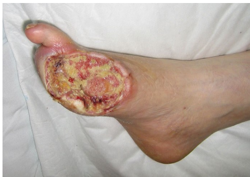
Slika 8.1. Dijabetičko stopalo ( https://poliklinika-kvaternik.hr , 22.4.2021.)

Dijabetičko stopalo specifičan je klinički entitet koji se vrlo često pojavljuje kod bolesnika s loše reguliranom šećernom bolesti, a uključuje sporo cijeljenje plantarnih ulceracija koje nastaju kao rezultat beznačajnih oštećenja (lagani udarac, neodgovarajuća obuća, ozljeda prilikom rezanja noktiju i sl.). Ako se na vrijeme ne prepozna i ne liječi, moguć je razvoj teških komplikacija kao što su celulitis, apsces te osteomijelitis. S obzirom na to da je kod ovih bolesnika uglavnom razvijena senzorna neuropatija, bolesnici nemaju osjet neugode ili bola što je preduvjet za dulje izlaganje traumi (3).