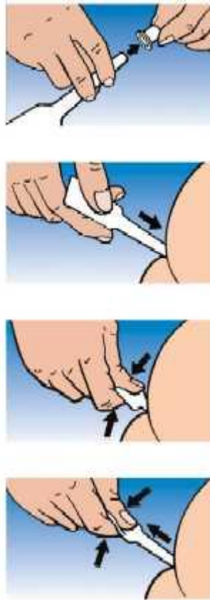
Slika 6. Postupak primjene mikroklizme diazepama

Kod primjene diazepam mikroklizme, medicinska sestra najprije treba otkloniti čep sa vrha štrcaljke, a zatim gluteuse djeteta razmaknuti kako bi olakšala pristup rektumu. Radi osjetljivosti rektuma važno je da sestra polagano i što nježnije primjeni vrh štrcaljke mikroklizme u rektum. Sestra pritišće klip mikroklizme te broji do tri i ne smije otpustiti klip kako ne bi došlo do povratka sadržaja nazad u tubu. Zatim oprezno i polagano vaditi vrh štrcaljke mikroklizme te opet brojati do tri. Kada izvadi vrh štrcaljke, sestra će odmah pritisnuti oba gluteusa sa rukama opet brojeći do tri kako bi se spriječio izlazak sadržaja mikroklizme diazepama iz rektuma (19).