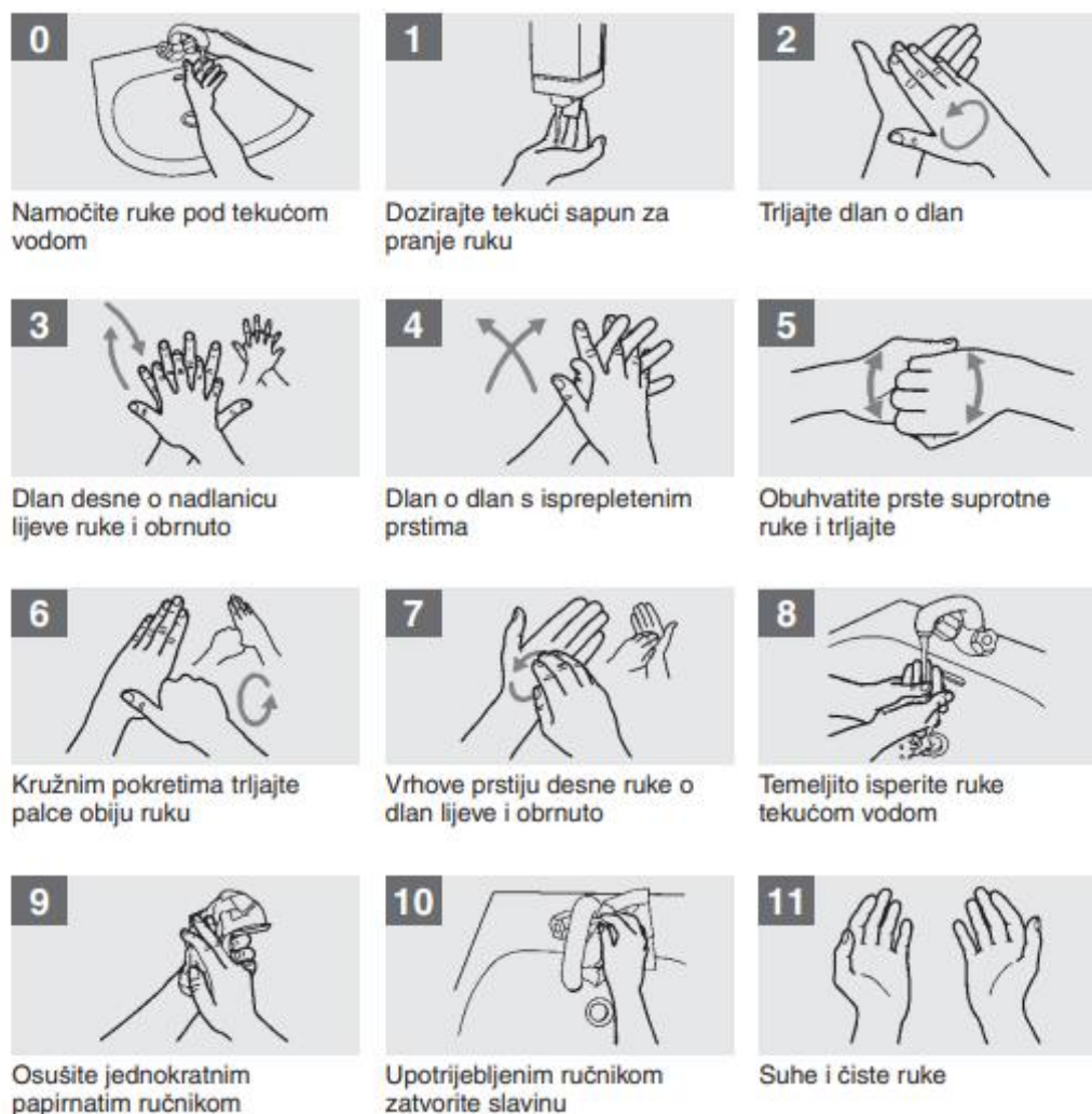
Slika 4.3. Higijensko pranje ruku [9]