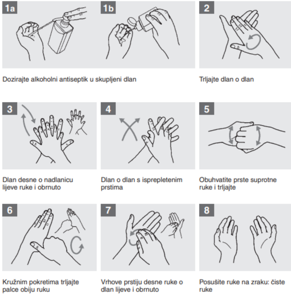
Slika 4.2. Higijensko utrljavanje ruku [9]