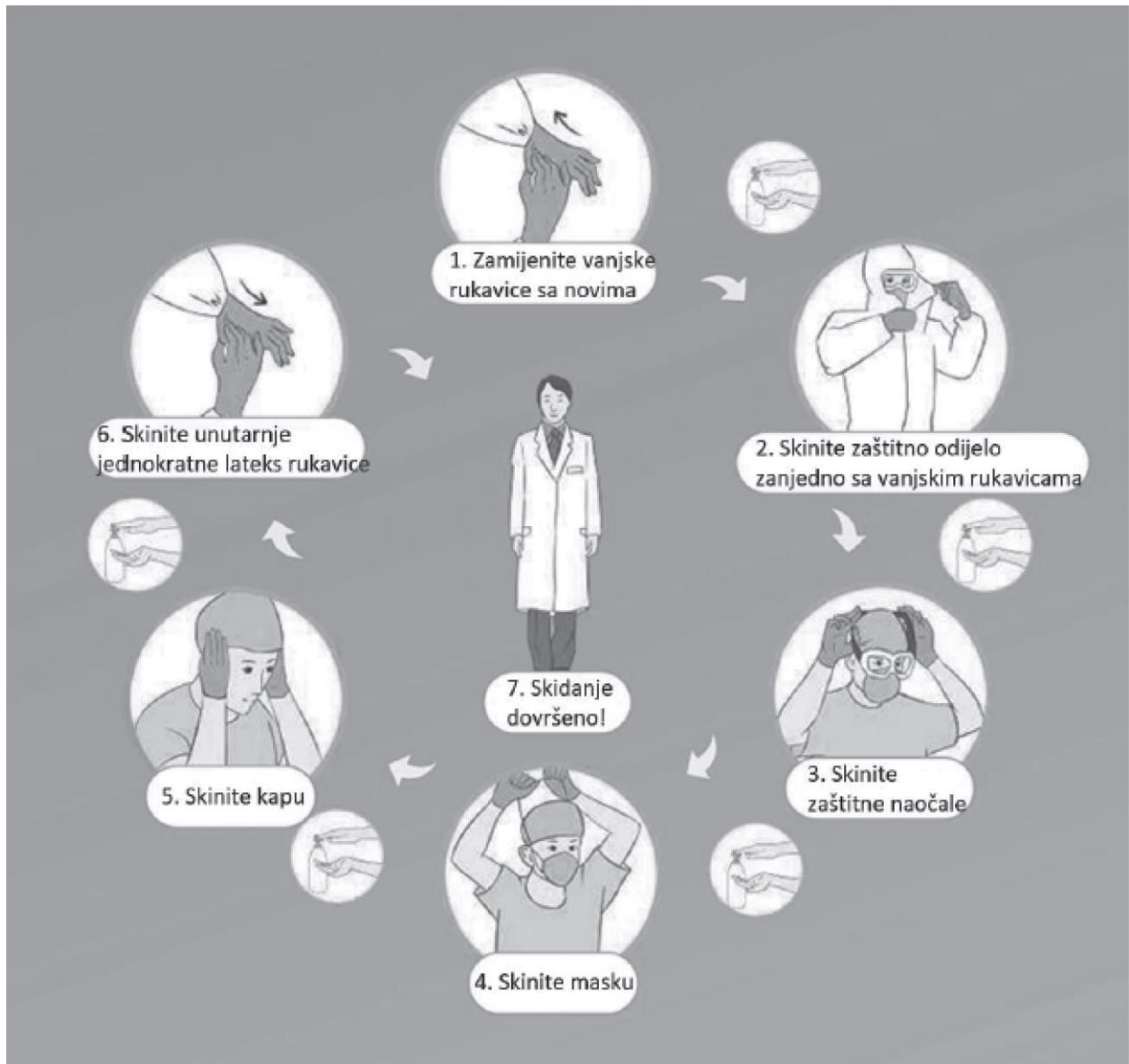
Slika 5.2. Protokol skidanja zaštitne opreme [38]

Zaštitna oprema se skida na mjestu predviđenom za skidanje, po mogućnosti u otvorenom prostoru, i odlaže u spremnike za bioinfektivni otpad.