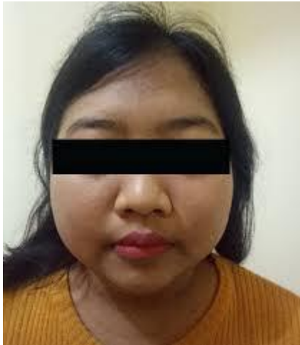
Slika 3.7.1. Moon face