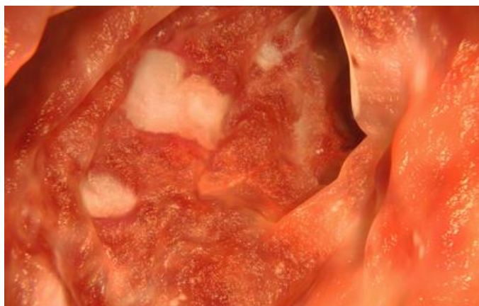
Slika 3.1.1. Ulcerozni kolitis sigmoidnog kolona

Za ulcerozni kolitis su karakteristične krvavo-sluzavo proljevaste stolice, grčeviti bolovi u abdomenu. Bolest najčešće počinje podmuklo, pojačanim nagonom na defekaciju. Neki slučajevi ulceroznog kolitisa se razvijaju nakon infekcije amebijazom ili bacilarnom dizenterijom.