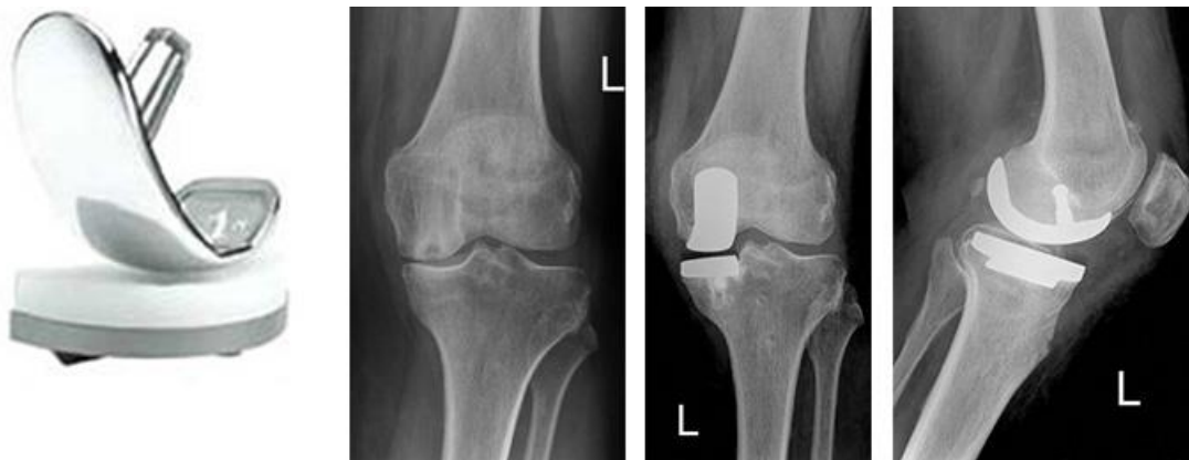
Slika 1.5.3.1. Parcijalna endoproteza koljena