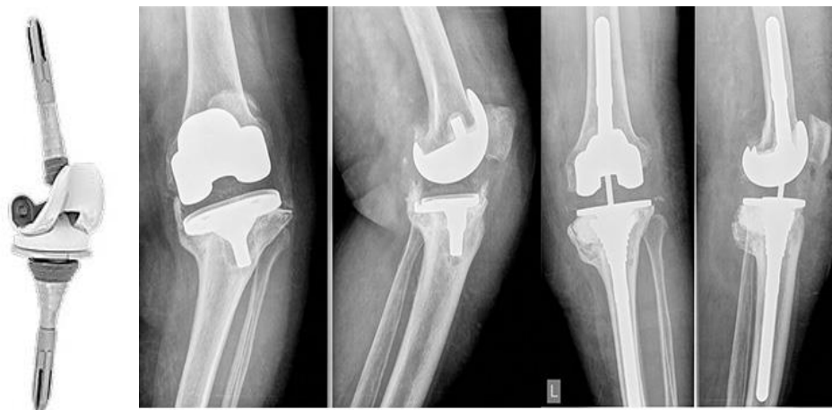
Slika 1.5.3.2. Revizijska endoproteza koljena

Revizijska endoproteza označava ugradnju proteze koljena nakon što primarna endoproteza olabavi i popusti, što je prikazano na slici 1.5.3.2. Ona daje mogućnosti ponovne ugradnje endoproteze nakon što se primarna izvadi. Kada primarna endoproteza olabavi i rasklima se dolazi do različitih stupnjeva oštećenja koštane mase.