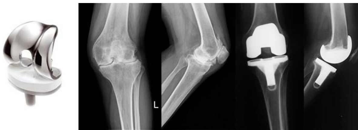
Slika 1.5.4.1. Totalna endoproteza koljena

Totalnom endoprotezom koljena zamjenjuju se svi dijelovi koljenskog zgloba. Ona je izgrađena od čelika koji se postavlja na kondile femura, dok je tibijalni dio proteze od titana, na koji se postavlja polietilen radi smanjenja trenja, a koji čini patelarni dio. Bolesti i stanja u kojima je indicirana totalna endoproteza koljena su degenerativne bolesti u smislu osteoartritisa koljena, koji može biti uzrokovan ozljedom, upalnim procesima i reumatskim bolestima. Kontraindikacije za postavljanje totalne endoproteze koljena su: osteomijelitis, periferna vaskularna bolest, ozljeda kože ili lokalna infekcija, uznapredovala osteoporoza i dr. Glavni cilj ugradnje je smanjenje ili uklanjanje boli kod kretanja, vraćanje normalnog opsega funkcije i pokretljivosti. Kolateralni ligamenti kod ugradnje totalne endoproteze koljena ostaju očuvani i netaknuti, stražnji križni ligamenti se mogu, a i ne moraju očuvati, a prednji križni ligamenti uklanjaju se kod kirurškog zahvata. Postoje fiksne i pomične endoproteze, što se odnosi na polietilenski umetak koji može biti fiksiran ili pokretljiv u odnosu na tibijalnu komponentu endoproteze. Mobilne proteze ovisne su o ligamentima i mekim tkivima koji čine pasivne stabilizatore koljena. Slika 1.5.4.1. prikazuje totalnu endoprotezu koljena.