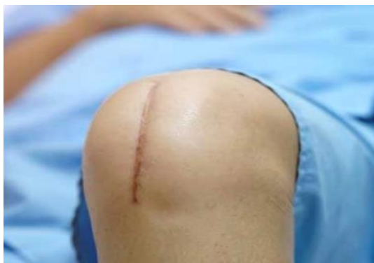
Slika 1.7.2. Ožiljak nakon ugradnje totalne endoproteze koljena