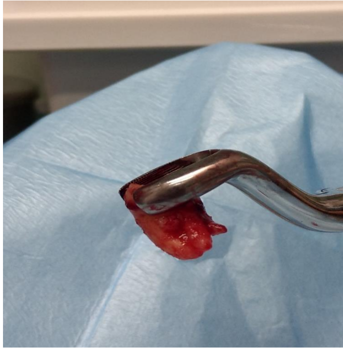
Slika 1.3.6. Prikaz ekstrahiranog kutnjaka (28) pomoću gornjih umnjačkih kliješta