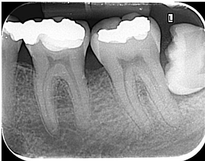
Slika 1.2. Radiološki prikaz horizontalno retiniranog trećeg kutnjaka

njegova kruna dotiče korijene susjednog zuba. Zub je vidljiv samo na snimci, u usnoj šupljini je prekriven zubnim mesom.