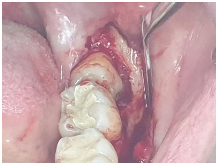
Slika 1.3.3. Prikaz degažirane gingive i zubne krune posljednjeg kutnjaka

Na slici 1.3.6. vidi se u potpunosti izvađeni treći kutnjak, gornje lijeve strane čeljusti i gornja umnjačka kliješta. Kruna trećih gornjih kutnjaka je manja u odnosu na prvi ili drugi kutnjak te pravilnijeg okruglog oblika tako su i kliješta takvog oblika.