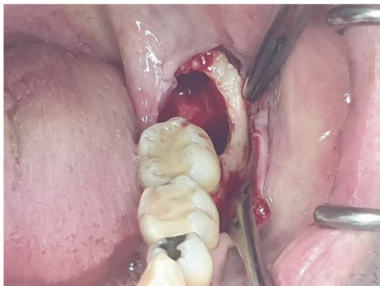
Slika 1.3.4. Prikaz ekstrakcijske rane u donjoj čeljusti