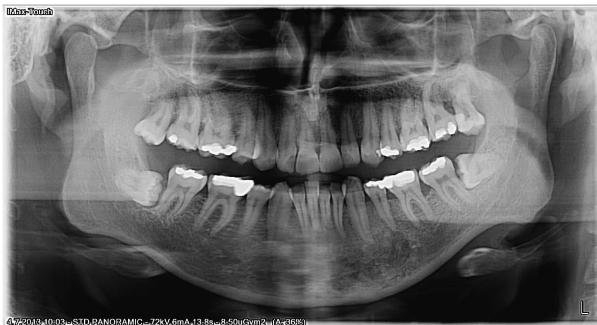
Slika 1.3.2. Prikaz snimke digitalnog ortopantomografa

čeljusnog zgloba. Uređaj može biti analogni ili digitalni (20). Pretragom su vidljive sve promjene na kostima koje mogu upućivati na zloćudne i degenerativne bolesti. Osim zuba koji se vide u ustima mogu se vidjeti i zubi koji nisu nikli npr. položaj zametka umnjaka, te promjenu koštanog tkiva gornje i donje čeljusti. Slikovni podatci važni su oralnom kirurgu za izvedbu zahvata, a medicinskim sestrama služe u pripremi bolesnika i instrumenata. Slika 1.3.2. je ortopantomogram svih zubi usne šupljine i obje čeljusti. Vide se svi zubi, sinusne šupljine, gustoća kostiju i nepravilan, vodoravan položaj donjih posljednjih kutnjaka.