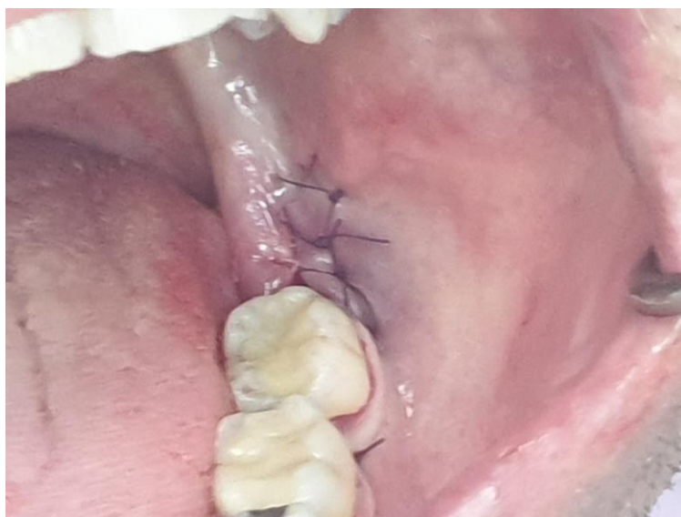
Slika 1.3.5. Prikaz šavom primatnutih rubova ekstrakcijske rane