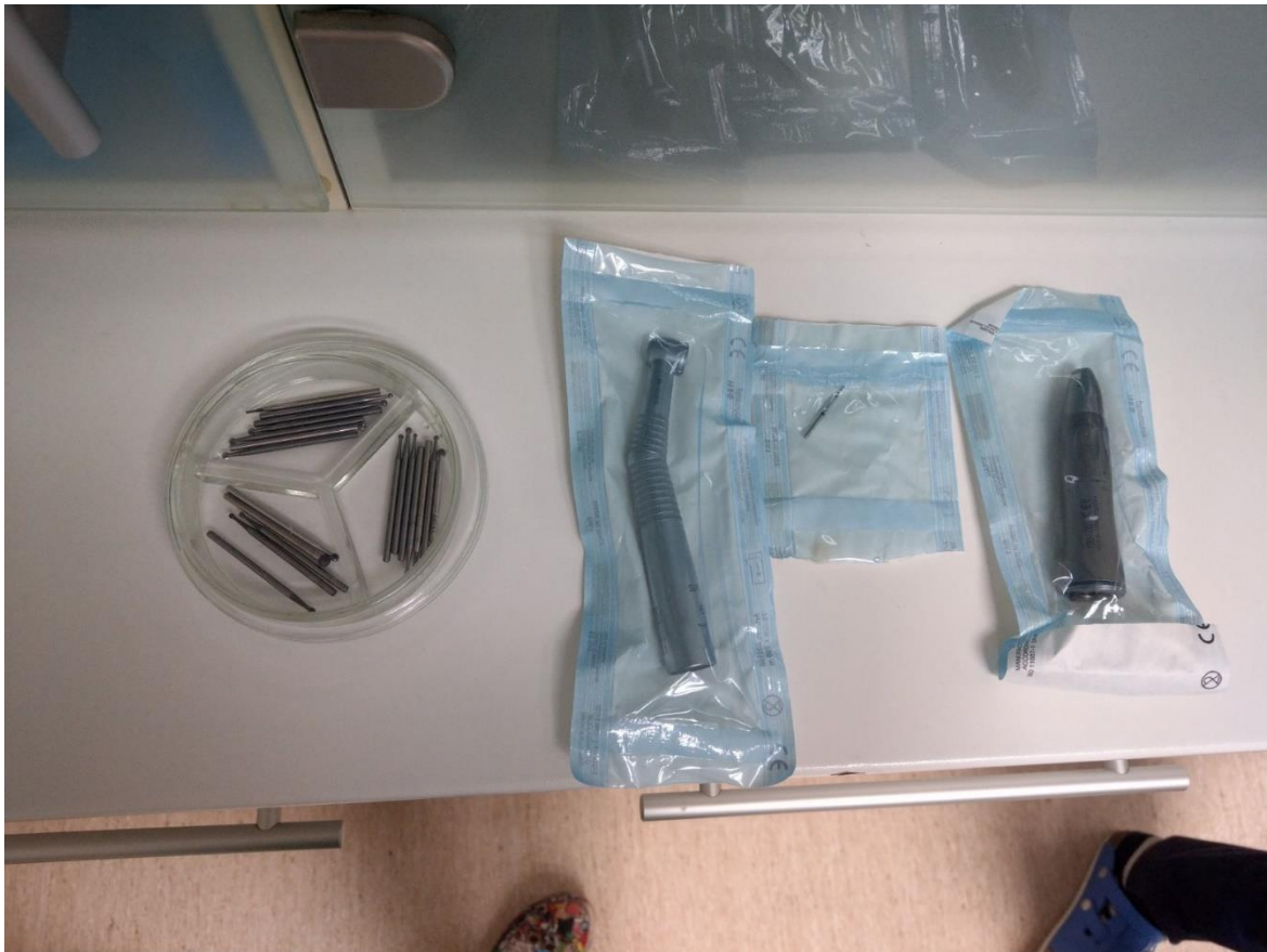
Slika 1.6. Prikaz zapakiranih djelova, turbinska vrtaljka i mikromotor