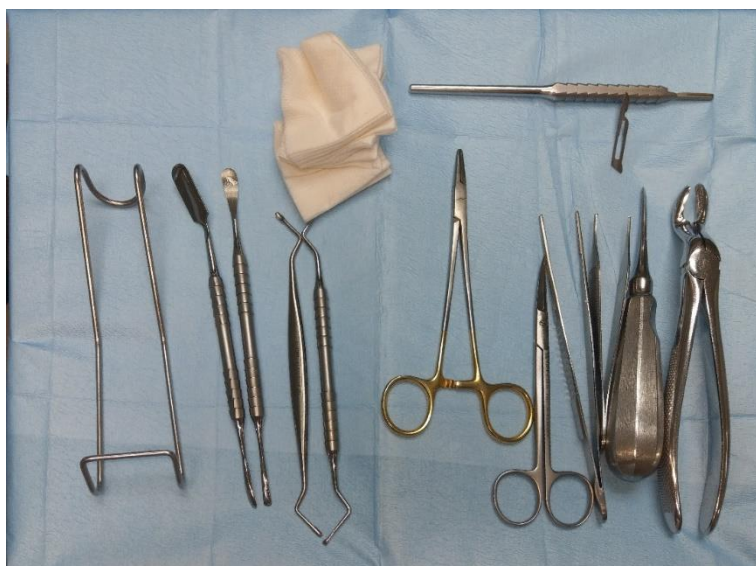
Slika 1.9.2. Osnovni instrumenti za dentoalveolarnu kirurgiju