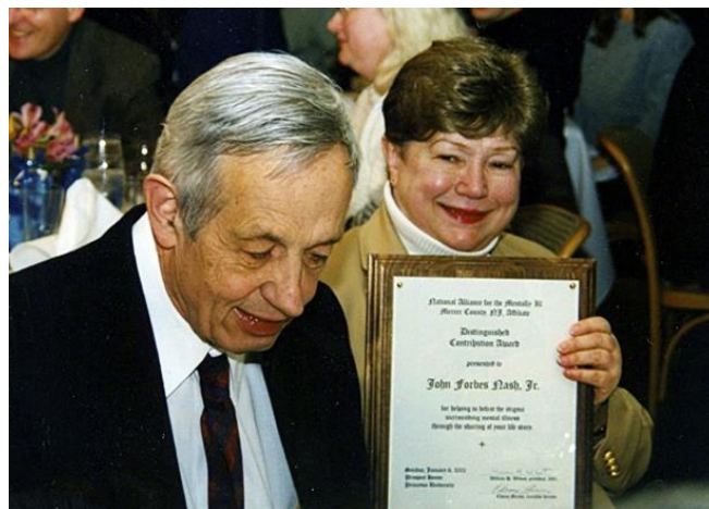
Slika 8.1.1 John Nash, američki matematičar i nobelovac -obolio od shizofrenije

Vrlo često ljudi misle da su osobe oboljele od shizofrenije opasne. Naime, mediji u većini slučajeva shizofrene osobe predstavljaju kao agresivne i nasilne. Agresivnost se može pojaviti, no češća je kod neliječene shizofrenije nego kod one koja je pod utjecajima psihofarmaka i pod liječničkom kontrolom. Nadalje, ljudi smatraju da je shizofrenija neizlječiva bolest (11). Danas se uspješno provode dugotrajne i trajne remisije bolesti, a kod ostatka se simptomi ublažuju i stanje poboljšava, te uspješno žive reintegrirani u zajednici (10). Ljudi prepostavljaju da osobe oboljele od shizofrenije nesposobne odlučivati same za sebe te da, zato što su bolesni, ne mogu uspjeti u životu. No, tu teoriju neće potkrijepiti činjenica da je John Nash, američki matematičar koji je vodio veliku borbu sa shizofrenijom, dobitnik nobelove nagrade za djelo „Teorija igara“ (engl. „Game theory“). Vincentu van Goghu, vodećem svjetskom umjetniku, također je dijagnosticirana shizofrenija što ga nije sprječavalo u postizanju svoga uspjeha. Van Gogh je svoje remek-djelo „Zvezdana noć“ naslikao upravo tijekom boravka u psihijatrijskoj bolnici u Saint Rémyju u Francuskoj. Umjetnik je za vrijeme svog boravka u bolnici napisao: „Neprestano radim u svojoj sobi, to mi čini dobro i rastjeruje moje abnormalne misli i ideje.“ (11).