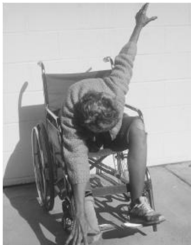
Slika 6.1.1 Katatonička ehopraksija (oponašanje tuđih pokreta) Dostupno na:

Prema MKB-10 dijagnostičkoj klasifikaciji postoji i postshizofrena depresija oznake F20.4. U postshizofrenoj depresiji javlja se visoki rizik za samoubojstvo, a sam tip bolesti predstavlja produžetak bolesti kada su shizofreni simptomi već oslabjeli odnosno, ne dominiraju kliničkom slikom. Nadalje, prema MKB-10 klasifikaciji postoji i simplex forma shizofrenije gdje oboljela osoba osjeća da se mijenja, postupno se povlači u svoj svijet te se javlja postupno produbljanje negativnih simptoma bolesti (21).