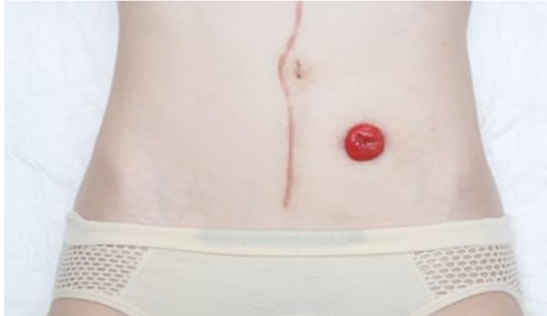
Slika 10.2.1.1. Prikaz kolostome