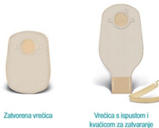
Slika 13.4.2. Vrste vrećica za stomu

Bolesnici s kolostomom imaju krući izmet i obično se prazni jednom ili dva puta dnevno, pa se preporučuje jednokratna zatvorena vrećica. Višekratne vrećice koje se mogu prazniti, preporučuju se u slučaju proljeva (23).