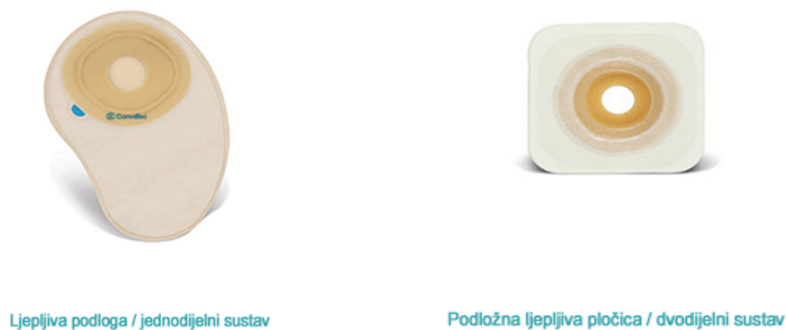
Slika 13.4.1. Jednodijelni i dvodijelni sustav stome

Bolesnicima koji puno sjede ili se često sagibaju, preporuča se da odaberu jednodijelno pomagalo jer se lakše savija i mekše je od dvodijelnog pomagala s prstenom, tj. manje smeta kod slobodnog kretanja, dobro prijanja uz tijelo i dobro se prikriva. Ako je koža osjetljiva, savjetuje se dvodijelni sustav jer je podložnu pločicu dovoljno mijenjati nakon tri dana (23).