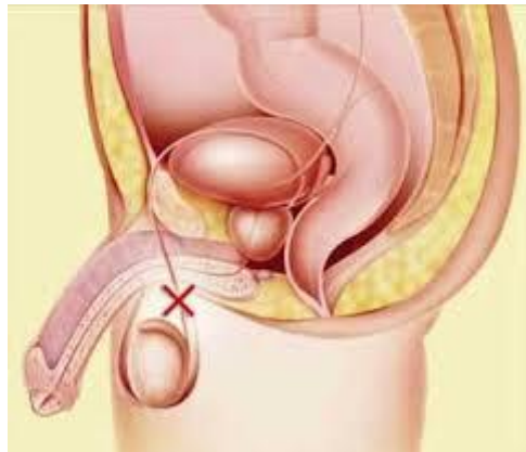
Slika 7.4. Mjesto sterilizacije muškaraca