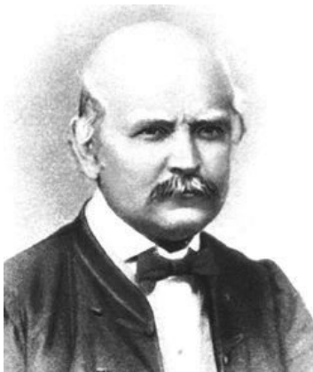
Slika 1. Ignaz Phillip Semmelweis (11)

U to vrijeme jedan od liječnika bečke Opće bolnice bio je Ignaz Phillip Semmelweis (1818.-1865.) u povijesti poznat kao "spasitelj majki" koji je napravio veliki preokret u povijesti bolničkih infekcija (2). Dr. Semmelweis je bio mađarski liječnik njemačkog porijekla. Rođen je u Budimu 1818. g. Nakon srednjoškolskog obrazovanja započeo je studij prava koji je kasnije zamijenio studijem medicine. Diplomirao je medicinu 1844.g. u Beču u dobi od 25 godina. Iste godine počinje raditi u Općoj bolnici u Beču „Das allgemeine Krankenhaus“ koju je osnovala Marija Terezija 1763. godine (2).