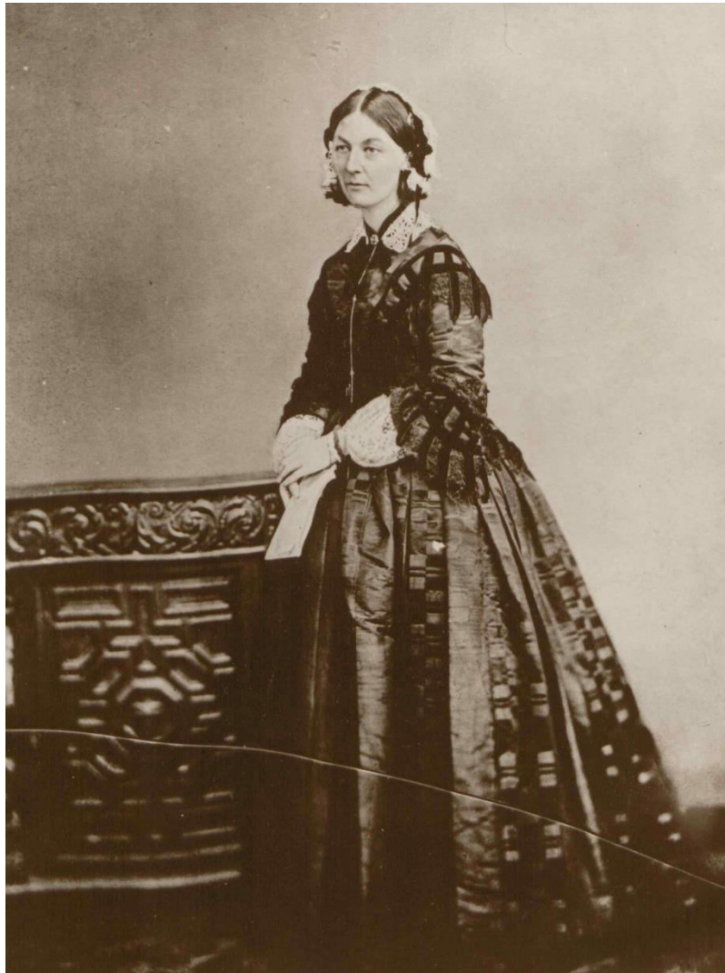
Slika 3.1.1. Osnivačica modernog sestrinstva Florence Nightingale (1)