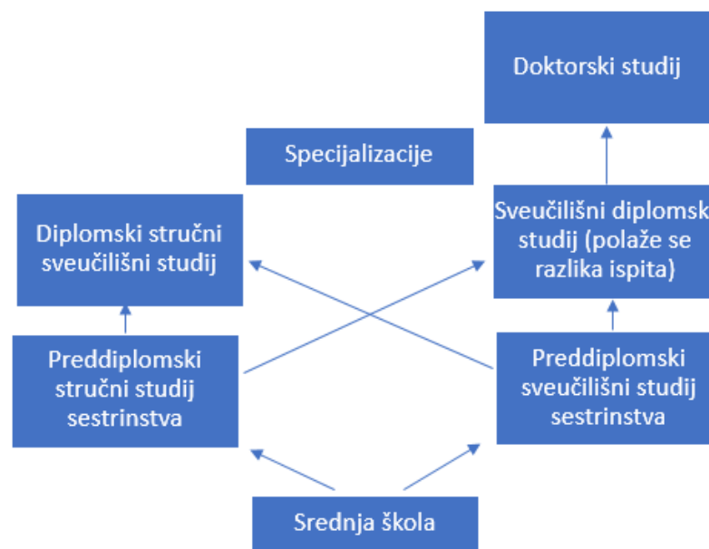
Slika 4.1.1. Vertikalna obrazovanja medicinskih sestara u Republici Hrvatskoj (3)

Obrazovanje medicinskih sestara u Republici Hrvatskoj provodi se na srednjoškolskoj i visokoškolskoj razini. Visokoškolsko obrazovanje provodi se na stručnim i sveučilišnim studijima. Na preddiplomskim studijima se obrazuju sveučilišni i stručni prvostupnici sestrinstva dok se na diplomskim studijima obrazuju diplomirane medicinske sestre i magistri sestrinstva. Po završetku diplomskog studija moguće je nastaviti obrazovanje na doktorskom studiju iz područja biomedicine i zdravstva, ( Slika 4.1.1.). Sveučilišni diplomski studij sestrinstva omogućuje napredak medicinskih sestara i da budu osposobljene za rad u svim zemljama Europske unije. Osposobljenost za provođenje znanstvenih istraživanja u procesu zdravstvene njege doprinosi objavljivanjem novih znanstvenih spoznaja koje su važne za razvoj sestrinstva kao znanstvene grane. Magistrima sestrinstva stečena znanja omogućuju kvalitetniji rad i obavljanje vodećih zadaća u zdravstvenom sustavu (3).