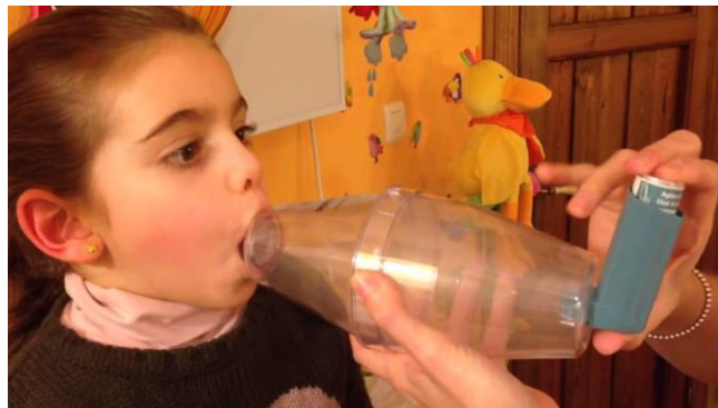
Slika 8. Djevojčica inhalira Ventolin (48)

Slika 8. prikazuje djevojčicu koja putem „volumatica“ inhalira Ventolin (48).