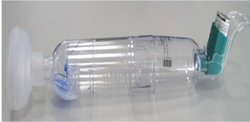
Slika 7. „Babyhaler“ (39)

Upotreba „babyhalera“ kod dojenčadi i djece do 5 godina, povećava učinkovitost raspršivača, jer se ne stavlja u usta, već postoji maska koja prekriva i nos i usta. Potrebno je naučiti roditelje pravilnoj tehnici primjene, kao i održavanja komorice, koja zahtjeva svakodnevno pranje (1, 37).