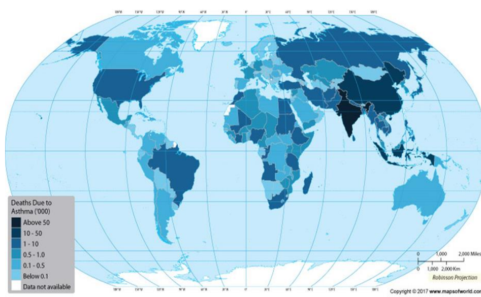
Slika 3. Mortalitet astme u svijetu (19)

Astma ne uzrokuje visoku stopu smrtnosti u svijetu, i ona iznosi manje od 1 %. Najviše stradavaju osobe starije dobi. Prema The Global Burden of Disease u 2016. godini 420.00 ljudi je umrlo od posljedica astme (14). U Europi zbog egzacerbacija astme umre 180.00 ljudi godišnje (16).