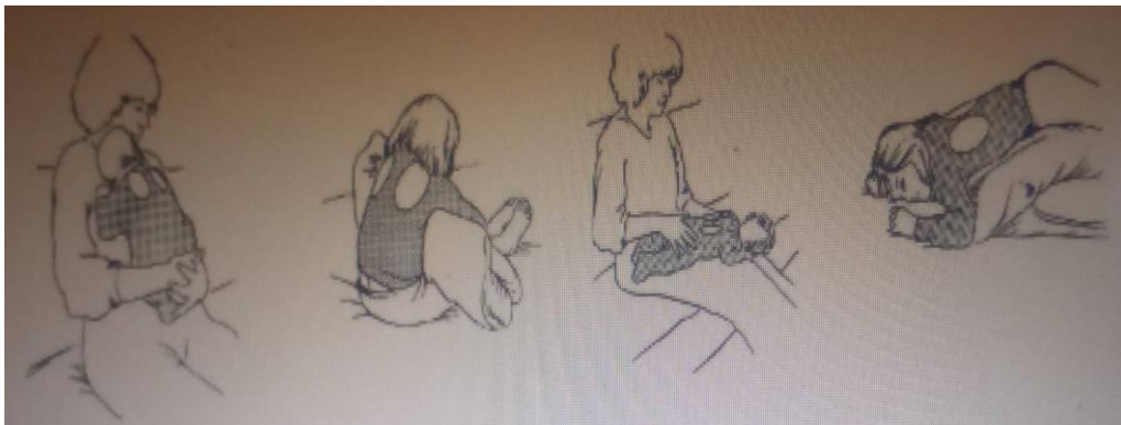
Slika 10. Drenažni položaji za eliminaciju sekreta iz vrhova pluća, i donjih stražnjih područja. (51)

Posturalna drenaža je smještanje djeteta u određeni položaj, koji omogućuje uklanjanje obilnog sekreta iz pluća, naročito nakon popuštanja bronhospazma. Pozicioniranje djeteta ovisi o lokalizaciji sekreta u plućima. Segment pluća u kojem je sekret, mora biti u što vertikalnijem položaju na odnosu na glavne bronhe. Djelovanjem sile teže, sekret se pomiče iz perifernih bronha u velike, gdje se nalaze receptori koji potiču kašalj. Trajanje drenaže se određuje individualno, prema potrebi djeteta, u prosjeku iznosi 15 do 30 minuta. Izvođenje drenaže ovisi o težini i učestalosti astmatskih napada. U teškim egzacerbacijama drenaža se izvodi jednom do dva puta dnevno. Može se provoditi u bolnici ili van nje, pa je potrebno educirati roditelje, da je sami izvode kod kuće. Drenaža gornjih režnjeva se izvodi ujutro, a donjih i srednjih navečer (50, 51). Slika 10. prikazuje drenažne položaje za eliminaciju sekreta iz vrhova pluća, i donjih stražnjih područja (51).