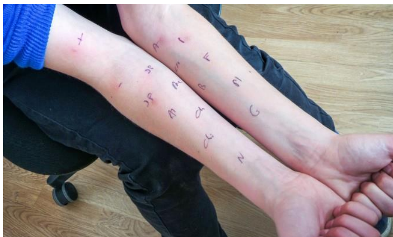
Slika 5. Kožni skin prick-test (32)