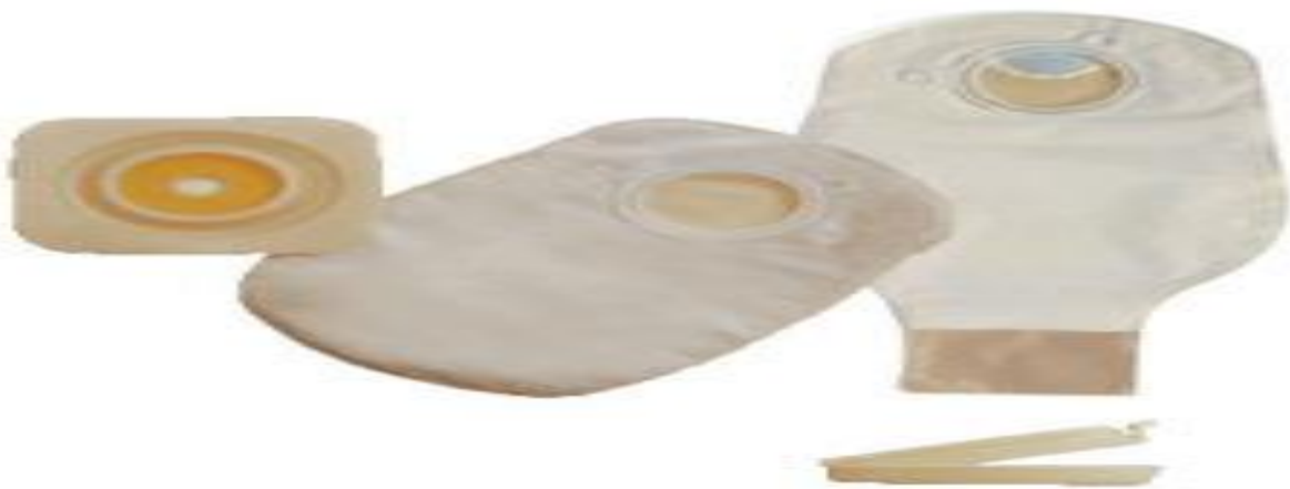
Slika 7.1. Vrećice i pločica (podloga) za kolostomu