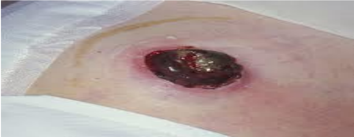
Slika 8.1. Nekroza kolostome