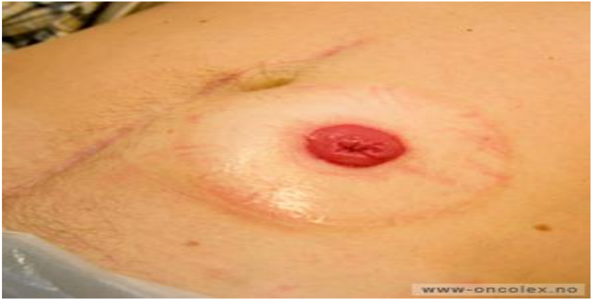
Slika 4.2. Izvedena okrugla kolostoma