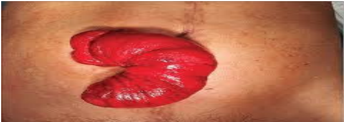
Slika 8.2. Prolaps kolostome

Prolaps kolostome je ispadanje svih slojeva crijeva kroz otvor kolostome (Slika 8.2). Nastaje zbog samog otvora kolostome ili povišenog intraabdominalnog tlaka. Medicinska sestra mora prepoznati novonastalu komplikaciju i obavijestiti liječnika. Pri manipulaciji s crijevima treba biti osobito pažljiv kako ne bi ozljedili crijevo.