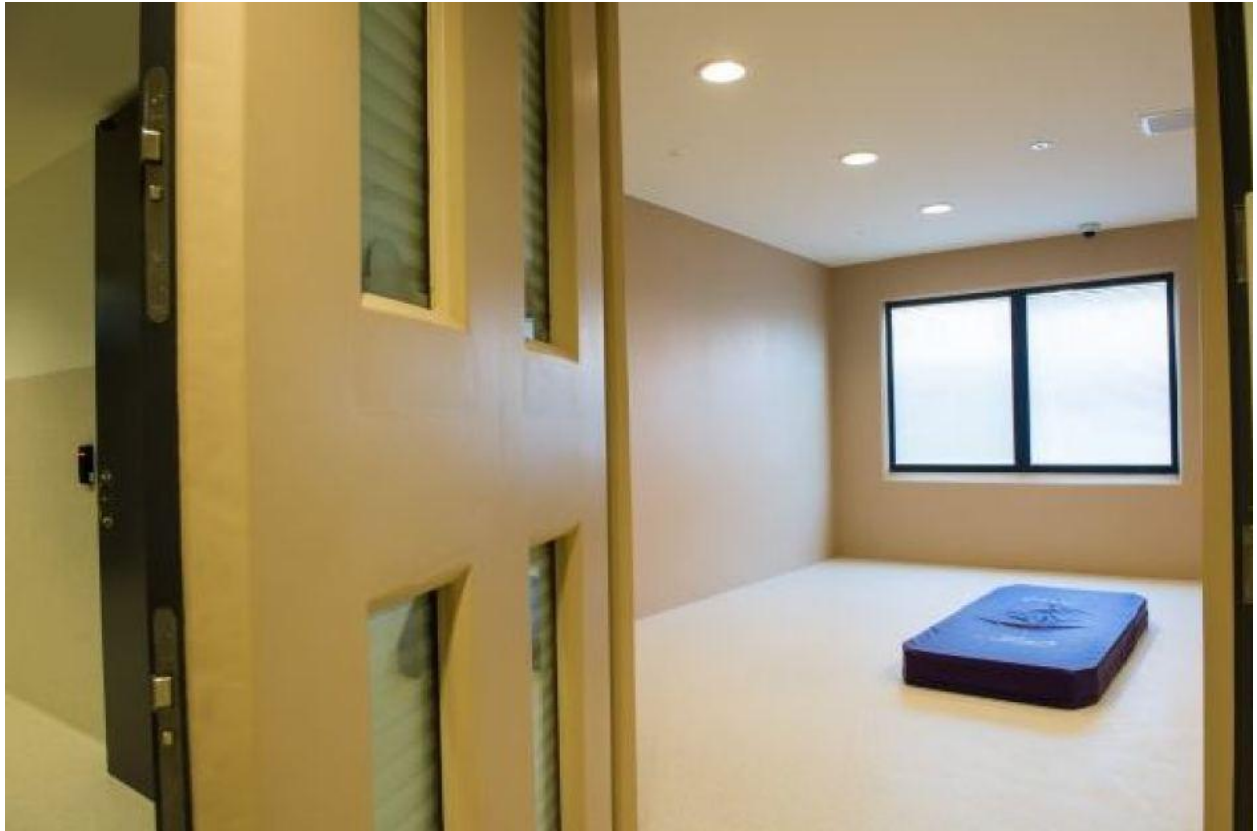
Slika 2. Soba za izolaciju

Tijekom postupka izdvajanja potrebno je razgovarati s pacijentom u onoj mjeri u kojoj je to moguće, a nakon završetka mjere izdvajanja također je potrebno obaviti razgovor s pacijentom kako bi se razjasnile okolnosti koje su dovele do ovakvog postupka (2).