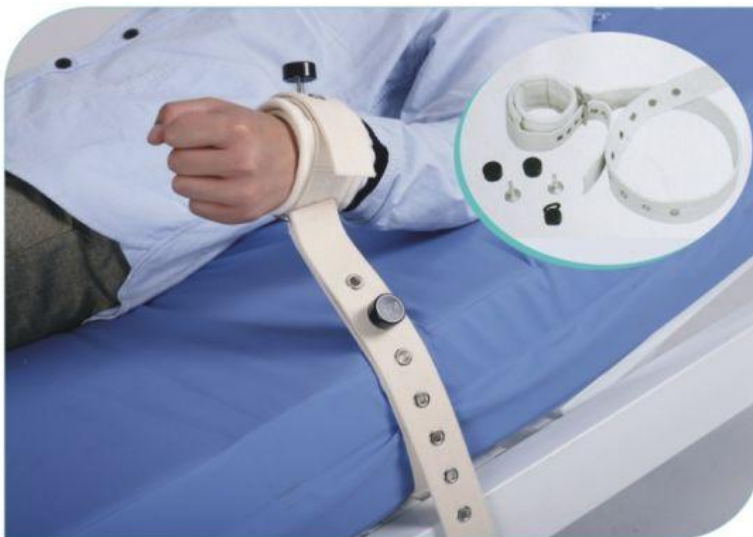
Slika 1. Najčešće korišteno sredstvo fizičkog sputavanja – magnetni remeni

Nakon prestanka indikacija za daljnje fizičko sputavanje, potrebno je obaviti razgovor s pacijentom u kojem će se sagledati sve okolnosti koje su dovele do takve neugodne situacije, te daljnje mogućnosti prevencije takvih događaja (2). Fizičko sputavanje provodi se posebno napravljenim remenjem ili narukvicama koje može biti od raznih materijala, a najčešće su to koža, tkanina ili poliester. O fizičkom sputavanju ne možemo govoriti, a da ne spomenemo pojam humane fiksacije. To je način provođenja fizičkog sputavanja mehaničkim sredstvima koji u najvećoj mogućoj mjeri pridaje pažnju pacijentovom dostojanstvu i sigurnosti, ali i sigurnosti osoblja. Za provedbu takvog oblika sputavanja potreban je tim od 5 ljudi s time da je jedan od njih vođa tima na čiji znak započinje proces sputavanja. Svaki član tima odgovoran je za po jedan od pacijentovih ekstremiteta, a vođa tima preuzima nadzor i kontrolira pacijentove pokrete glave. Na žalost takav oblik fizičkog sputavanja na bolničkim odjelima je rijetkost zbog kroničnog nedostatka osoblja te u većini slučajeva na raspolaganju imamo samo dva ili tri člana tima što nikako ne zadovoljava standarde za humanu fiksaciju.