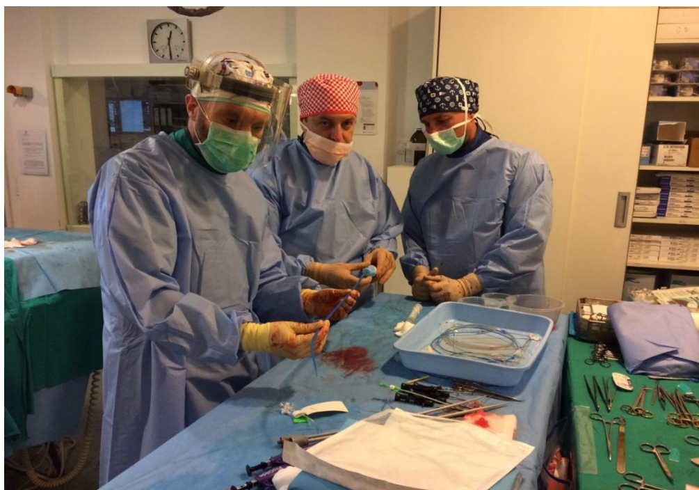
Slika 3.7. : Propiranje graft stenta