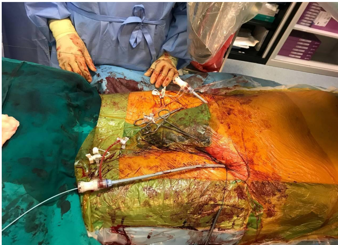
Slika 3.8. : Ugradnja graft stenta

Na slikama 3.8. i 3.9. prikazan je proces postavljanja graft stenta pod RTG snimkom.