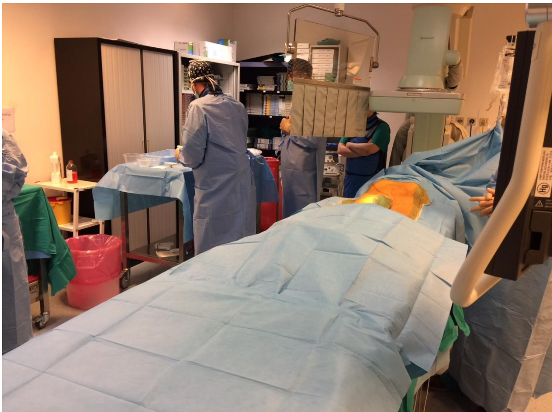
Slika 3.2. Priprema operacijskog polja i pacijenta

Izvor : KBC Zagreb, Klinički zavod za dijagnostičku i intervencijsku radiologiju