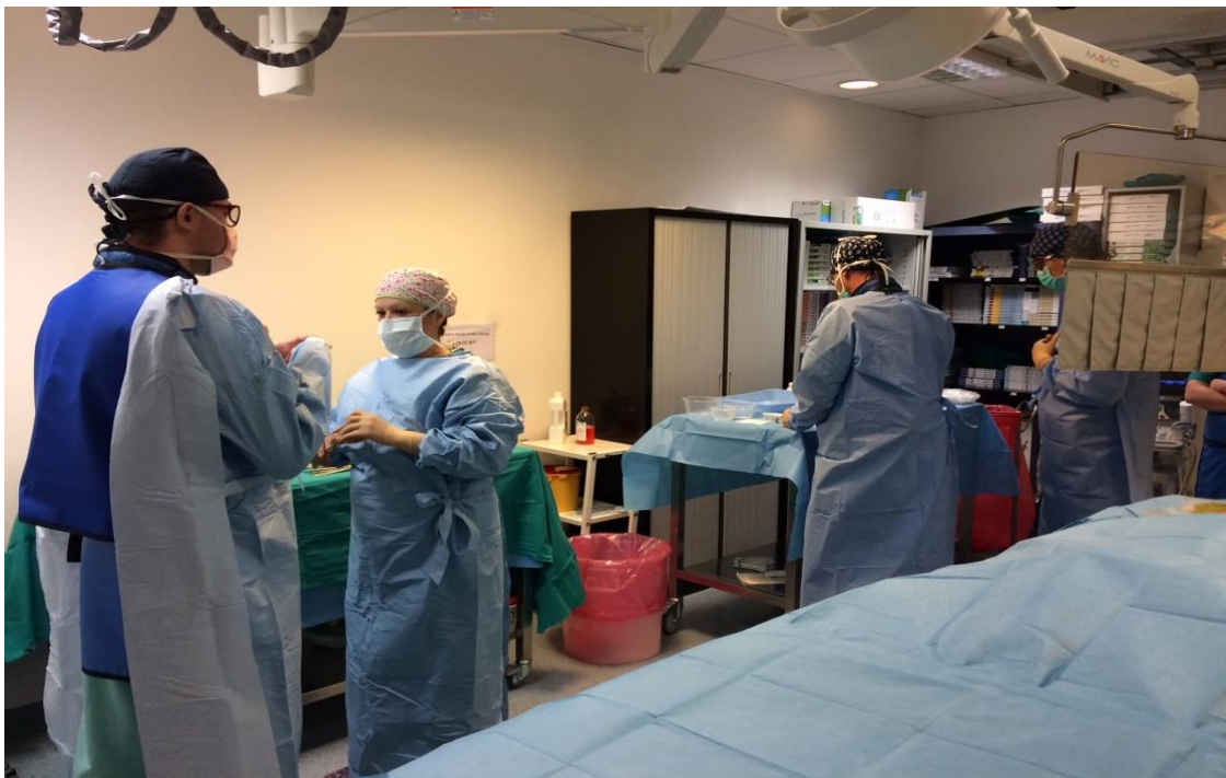
Slika 3.6. Medicinska sestra instrumentarka radiološke sale sterilno oblači intervencijskog radiologa koji zajedno sa vaskularnim kirurgom nastavlja zahvat