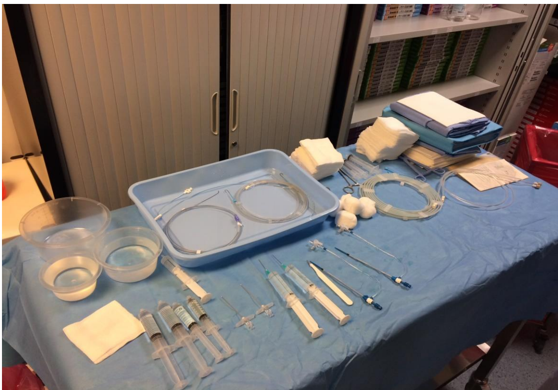
Slika 3.4. Sterilni stol sa potrebnim priborom za izvođenje EVAR-a