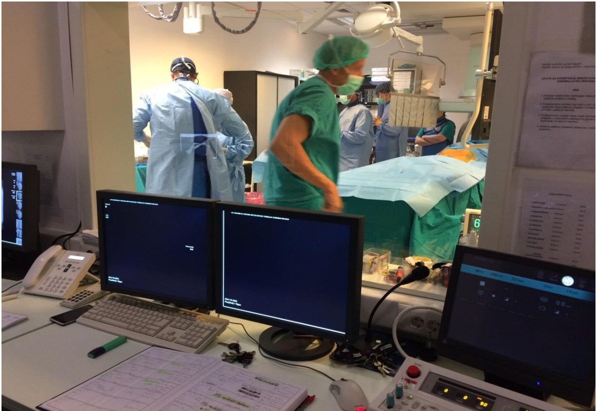
Slika 3.1. Početak priprema pacijenta i monitoringa za operativni zahvat

Interventni radiolog na osnovu dijagnoze pripremi graft stentove koji će se ugrađivati u pacijenta. Medicinska sestra zajedno sa doktorom sudjeluje u pripremi unatoč tome što ona kasnije dodaje graft stentove instrumentarki koja je za stolom ili daje instrukcije inženjeru radiologu kojim redosljedom će otvarati stentove.