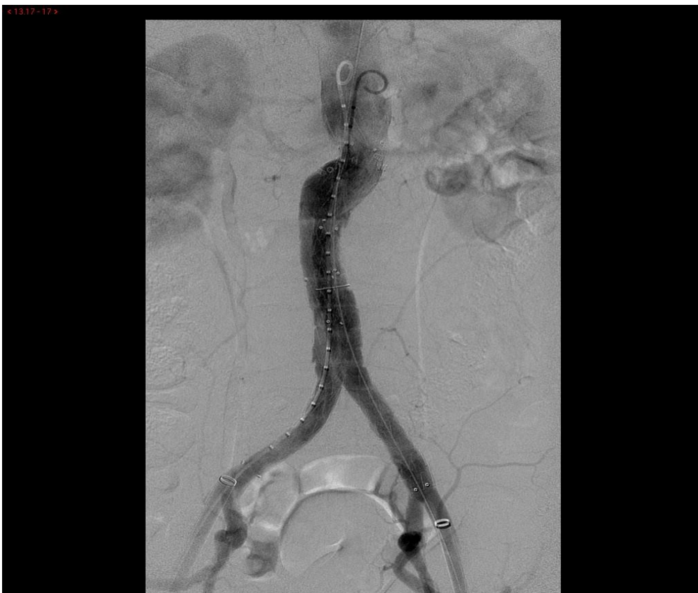
Slika 3.8. i 3.9. Prikazuju proces postavljanja graft stenta pod RTG snimkom