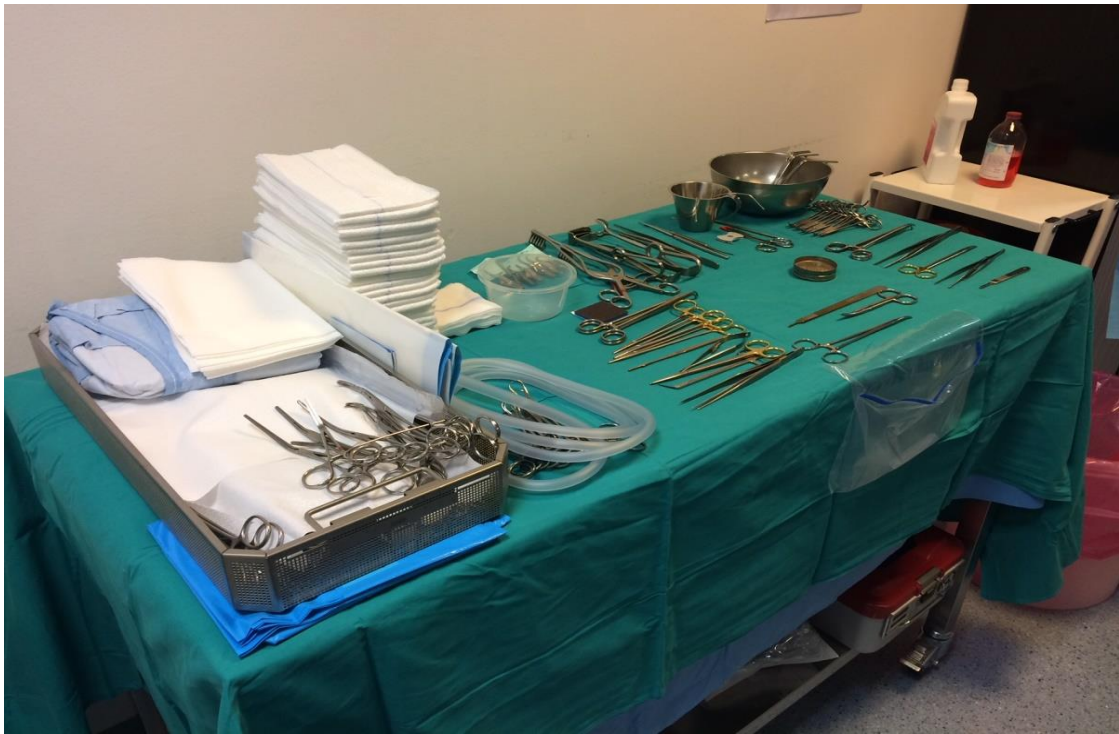
Slika 3.3. Sterilni stol sa instrumentima potrebnim za izvođenje EVAR-a