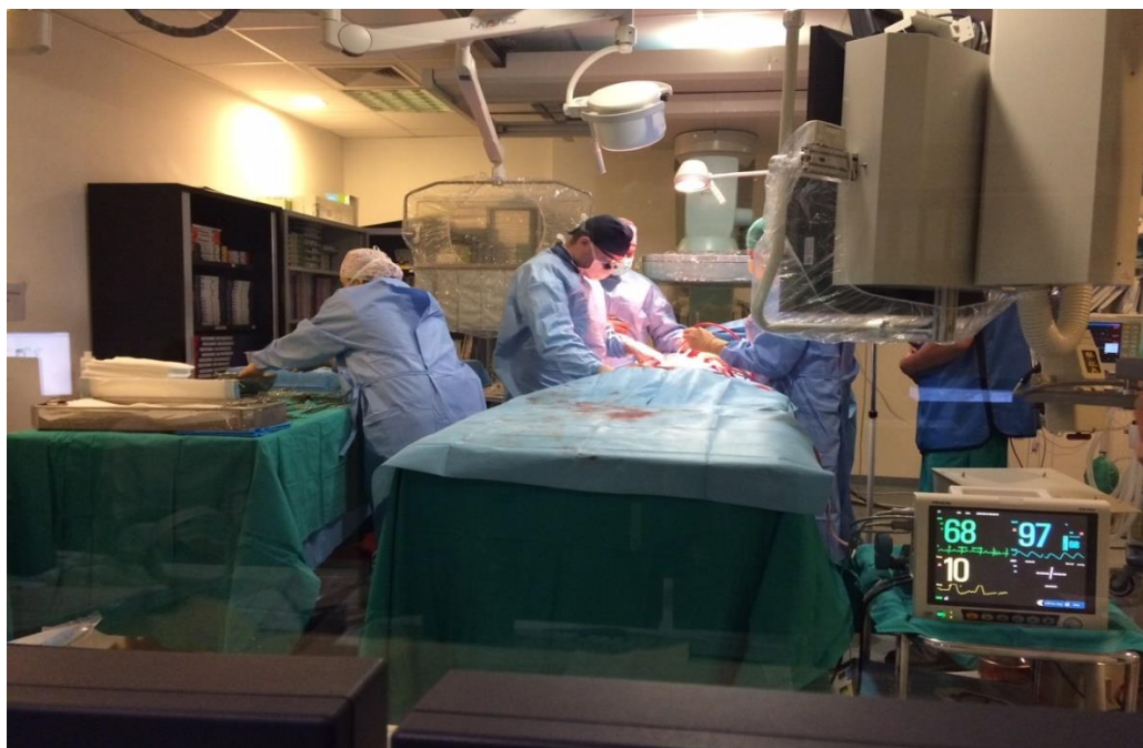
Slika 3.5. : Prepariranje krvnih žila femoralne arterije

Kada je graft stent postavljen i posao gotov od strane interventnog radiologa radiološka sestra instrumentarka odlazi od stola i dolazi ponovo vaskularna medicinska sestra instrumentarka i vaskularni kirurg završava zahvat (Slika 3.8.).