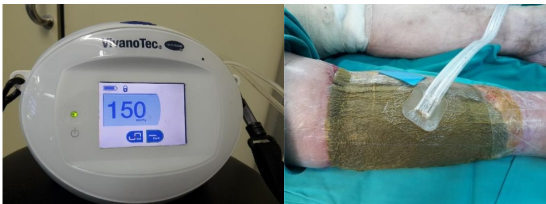
Slika 5. 1. 4. 1. Aparat za negativni tlak