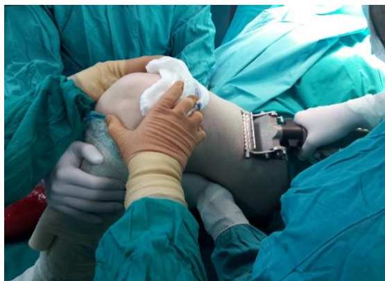
Slika 5. 2. 2. 1. Uzimanje kožnog transplantata

Uzimanje slobodnog kožnog transplantata je poznato i ubraja se u opće kirurške tehnike (3). Slobodni kožni presatci su tangencionalno uzeti dijelovi kože koji sadrže epidermis i dio (nepotpuna debljina) ili cijeli dermis (puna debljina). Uzimaju se najčešće s unutrašnje strane natkoljenice i nadlaktice. Njihova prednost je u tome što se mogu dobiti u većim količinama s malim defektom davajuće regije na način da se primjeni mrežasti autotranplantat djelomične debljine kože (mesh). No za njihovu primjenu potrebna je dobro vaskularizirana i minimalno kontaminirana podloga i pravilna imobilizacija tijekom revaskularizacije presadka.