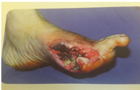
Slika 2. 3. 1. Dijabetičko stopalo

Pojavljuje se na stopalima. Incidencija pojavljivanja u dijabetičara je 2 % godišnje. Dijabetička neuropatija i angiopatija često se razvijaju istovremeno. Najčešće neadekvatna obuća, trauma ili infekcija pokreću slijed koji završava pojavom dijabetičkog ulkusa. Javljaju se najčešće na plantarnom dijelu stopala na mjestu najjačeg pritiska. Ovi ulkusi su skloni komplikacijama. Dijabetički ulkusi su najčešći uzroci amputacija stopala i noge (1).