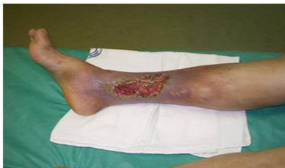
slika 2. 1. 1. Venski ulkus

(5).