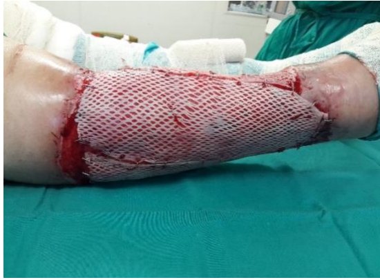
Slika 5. 2. 2. 2. Postavljeni kožni transplantat