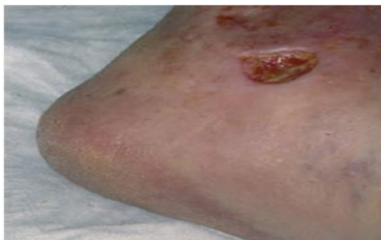
Slika 2. 2. 1. Arterijski ulkus

Lokaliziran je često u području palca ili prednjeg dijela i dorzuma stopala u cijanotičnoj arei, gdje koža pokazuje znakove nastanka gangrenoznih promjena. Kod bolesnika se pojavljuju često jaki bolovi, pa s obzirom na kliničku sliku, lokalizaciju promjena i bolove, u pravilu postavljanje dijagnoze je relativno lagano. Kod tipičnih kliničkih slika ulkus je pokriven žutim gnojnim eksudatom i dosta nekrotičnog sadržaja. Pri uklanjanju ovih naslaga vidimo da je proces napredovao sve do tetiva ili do dubokih fascija. Nema vidljivih granulacija. U praksi se može i preporučljivo je učiniti tzv. stepping test. On se sastoji od toga da bolesnik vježba 2-3 minute i tada dolazi do pojave bolova.