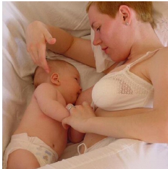
Slika 4. Ležeći položaj - Položaj je pogodan za prve dane dojenja i dojenja tijekom noći.