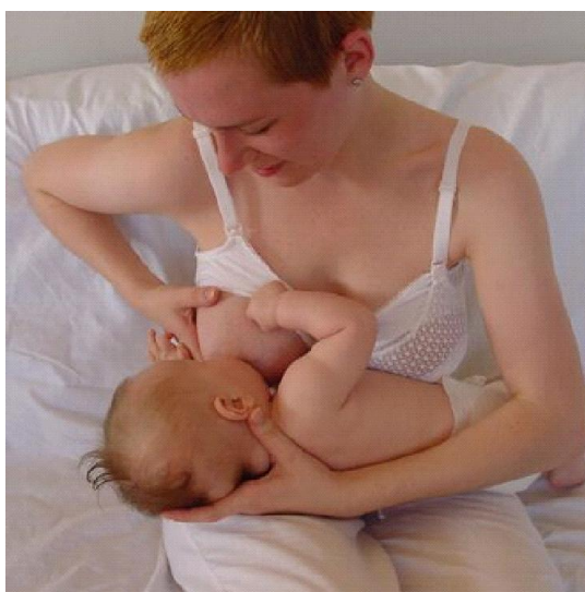
Slika 2. Poprečni položaj kolijevke