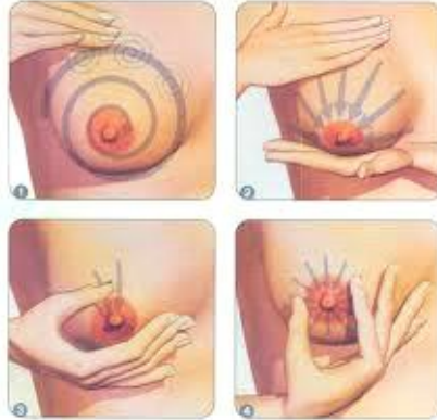
Slika 5. Marmet tehnika ručnog izdavanja

Koristiti obje ruke na objema dojčkama (8).