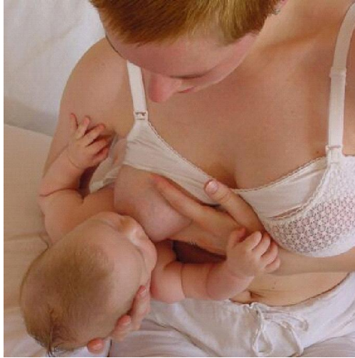
Slika 3. Položaj nogometne lopte - Položaj je pogodan za žene koje su rodile carskim rezom, jer je dijete smješteno bočno i ne pritišće majčin trbuh.