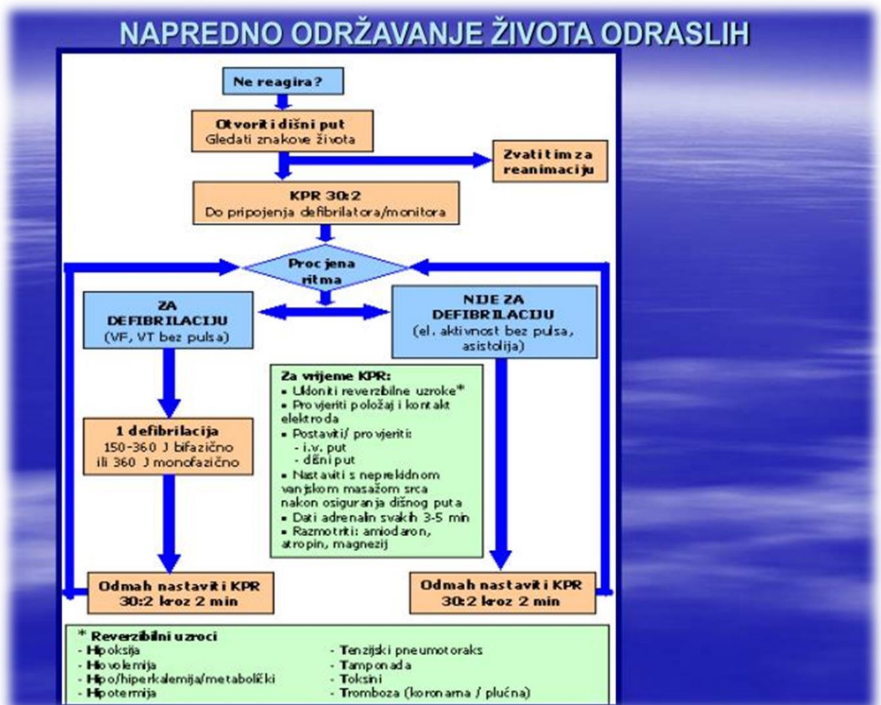
Slika 3. Postupnik za napredno održavanje života / Advanced life support algorithm.

Prema smjernicama ERC-a iz 2015. godine naglasak se stavlja na poboljšavanje skrbi i implementaciju smjernica kako bi se poboljšali ishodi fokusirani na bolesnike (Slika 2). U naprednom održavanju života odraslih stavlja se naglasak na minimalne prekide kompresija prsnoga koša koje se mogu prekinuti kratko kako bi se omogućilo izvođenje specifičnih postupaka što uključuje i prekid na 5 sekundi pri pokušaju defibrilacije [12]. Uporaba samoljepljivih elektroda za defibrilaciju. Valna kapnografija kako bi se potvrdio i neprekidno monitorirao položaj endotrahealnog tubusa, kvaliteta KPR-a i time omogućio rani povratak spontane cirkulacije [12].