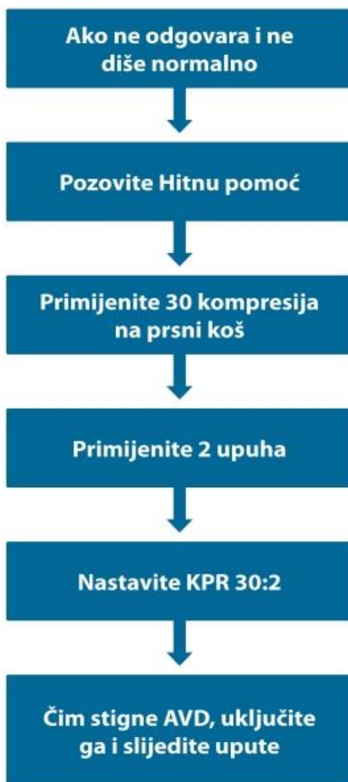
Slika 2. Postupnik za osnovno održavanje života uz uporabu automatskoga vanjskog defibrilatora. Izvor: http://www.crorc.org (19.06.2017).