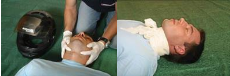
Slika 5. Postupak skidanja kacige. Izvor: Prva pomoc - SKRIPTA.pdf (22.06.2017).