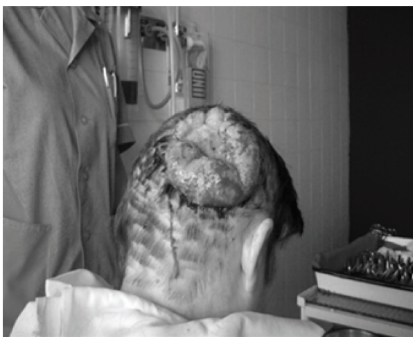
SLIKA/FIGURE 3. Prikazuje bolesnicu koja se nije javljala liječniku zbog brige o drugom članu obitelji. Teška anemija kao komorbiditet potaknula ju je da se javi liječniku. / The patient did not see a doctor because of taking care of another family member. Severe anemia as a comorbidity prompted her to see a doctor.

Gotovo uvijek veliku ulogu u nastanku ovako velikih tumora ima komorbiditet, najčešće alkoholizam, što pokazuje da se bolesnici ne liječe od alkoholizma. Tek komplikacije velikog tumora glave i vrata koje im remete normalne životne funkcije, u zakašnjoj fazi bolesti, dovode ih u našu skrb (Slika 4.) [10].