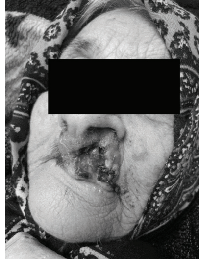
SLIKA/FIGURE 2. Pacijentica živi u udomiteljstvu. Vjerovala je da će to proći i da to ne treba dirati. / The patient lives in foster care. She believed that it would pass and that it should not be touched.