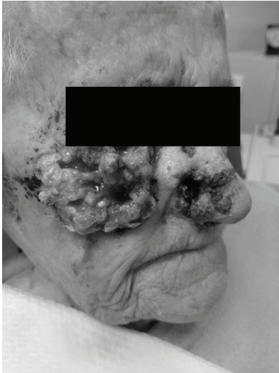
SLIKA/FIGURE 1. Prikazuje pacijenticu koja živi s obitelji. Zbog visoke životne dobi, pacijentica nije tražila liječničku pomoć. / The patient living with her family. Due to her advanced age, the patient did not seek medical help.