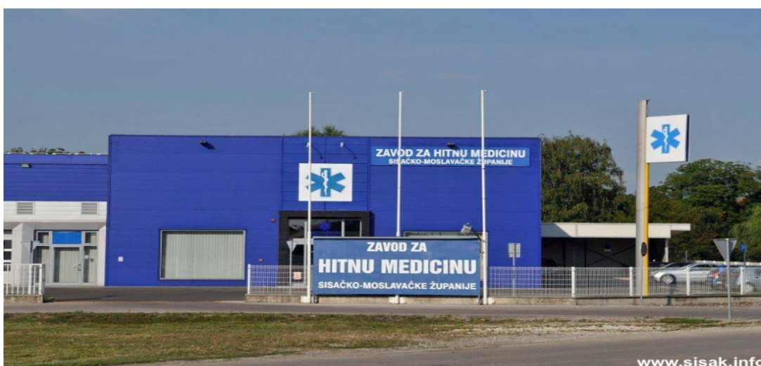
Slika 7. Zavod za hitnu medicinu Sisačko-moslavačke županije.