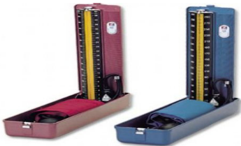
Slika 1. Živin tlakomjer.

Prilikom ove metode, osim ispravnosti uređaja (koji moraju biti redovito baždareni) mora se voditi računa o širini orukvice, jer premalena orukvica može rezultirati lažno visokim vrijednostima, i obratno. Svaka ambulanta morala bi uz tlakomjer uvijek imati nekoliko veličina orukvica.(6)