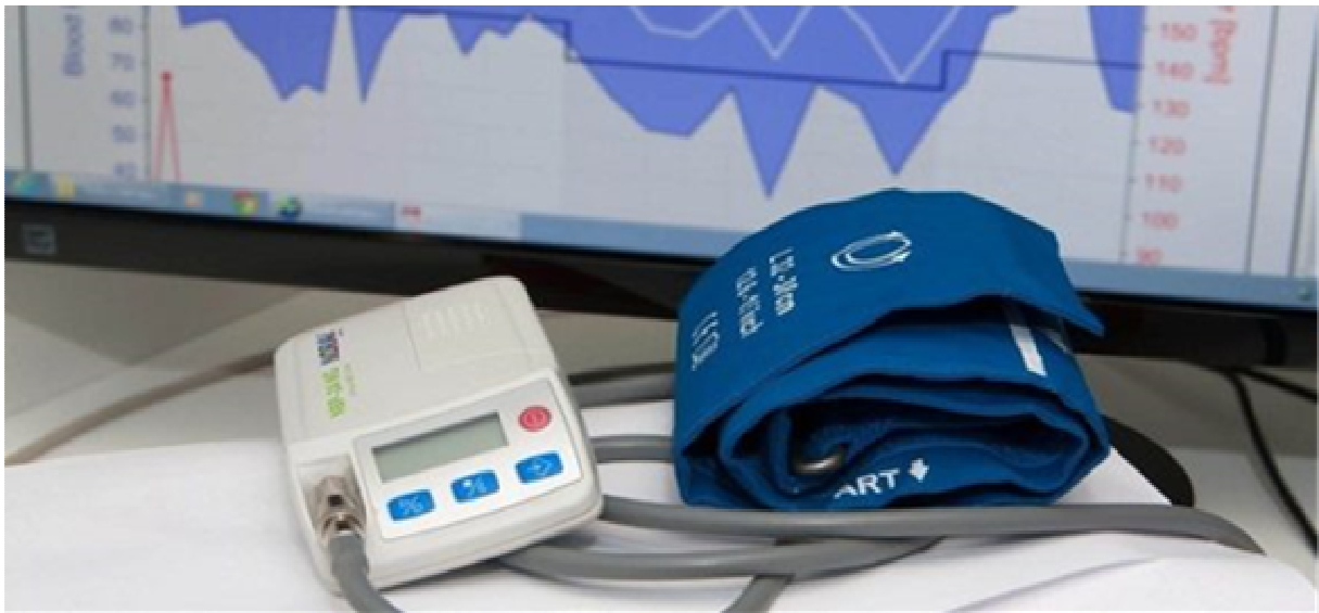
Slika 4. Uređaj za kontinuirano mjerenje arterijskog tlaka.

potpuno automatski, težine do 0,5 kg, mogu se nositi u manjoj torbici ili učvrstiti za pojas, tihi su i uglavnom ne ometaju samog nositelja u njegovim uobičajenim aktivnostima. Sastoje se od monitora koji su većinom oscilometrijski i zasnivaju se na detekciji oscilacija AT-a u orukvici. Maksimalna oscilacija krivulje tlaka pulsa odgovara srednjem AT-u, a sistolički i dijastolički AT-i određuju se s pomoću odgovarajućih formula i računalnih programa. Monitor je gumenom cjevčicom spojen s nadlaktičnom orukvicom (orukvice moraju biti prikladne veličine).