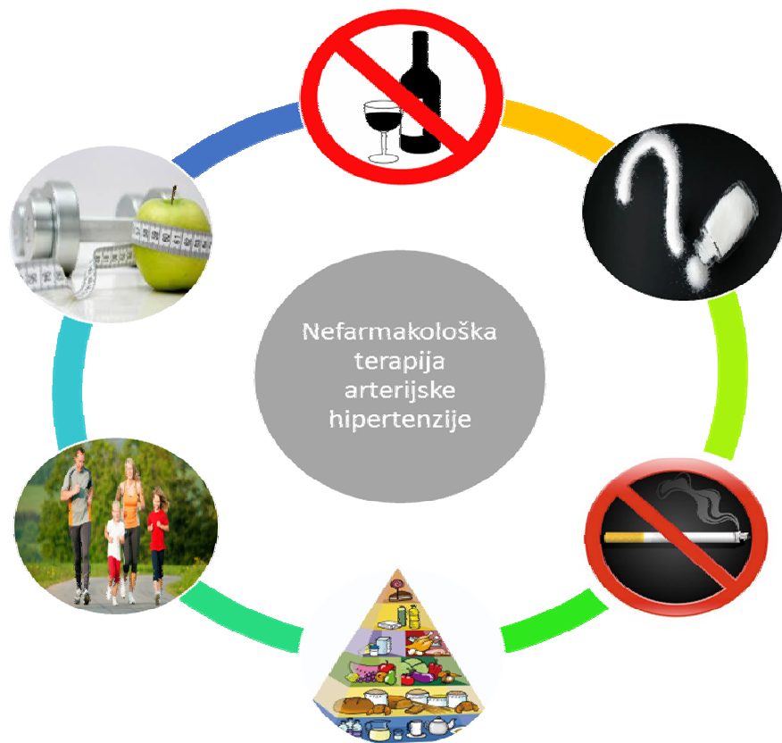
Slika 5. Nefarmakološko liječenje arterijske hipertenzije.

Smanjenje unosa kuhinjske soli – Prema preporukama SZO preporučena količina kuhinjske soli iznosi do 5 grama/dan. Podatci iz studije INTERSALT ( An International Study of Electrolyte Excretion and Blood Pressure ) ukazuju da prosječno izlučivanje natrija mokraćom iznosi 170 mmol / dan što odgovara 9,9 g soli. Prosječan unos kuhinjske soli u Hrvatskoj iznosi 11,6 grama dnevno (muškarci 13,3 grama, žene 10,2 grama). Prekomjerni unos soli može doprinijeti nastanku rezistentne AH.(14) Jedan od pretpostavljenih učinaka soli na porast AT je povećanje volumena izvanstanične tekućine i perifernog vaskularnog otpora dijelom zbog aktivacije simpatičkog živčanog sustava. Rezultati studija TOHP I i II ( Trials of Hypertension Prevention ) ukazuju da smanjenje unosa soli za 2 do 2,5 g dnevno za 30 % smanjuje nastanak kardiovaskularnih komplikacija. Smanjenje unosa kuhinjske soli može