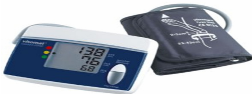
Slika 6. Uređaj za kućno mjerenje arterijskog tlaka. Preuzeto sa:

Bolesnika je svakako potrebno informirati o fiziološkoj varijabilnosti AT-a i o različitim graničnim vrijednostima ovisno o tehnici mjerenja, a također je vrlo važno upozoriti ga da samostalno i bez savjeta liječnika ne mijenja terapijski plan. Prilikom posjeta liječniku potrebno je donijeti svoj uređaj za kućno mjerenje AT-a radi provjere njegove točnosti usporedbom s vrijednostima izmjerenim živinim sfigmomanometrom, a odstupanja ne smiju biti veća od 5 mmHg. Nakon pet godina, ili ranije ako se pokaže da su netočni, uređaje bi trebalo zamijeniti. Samomjerenje kod kuće ne treba poticati kad uzrokuje potištenost, strah i zabrinutost bolesnika, osobito ako sam nije odlučio rabiti ovu tehniku. Također treba prekinuti s tim načinom mjerenja kada vidimo da to kod bolesnika potiče samostalna i samovoljna upletanja u terapijski plan.(7)