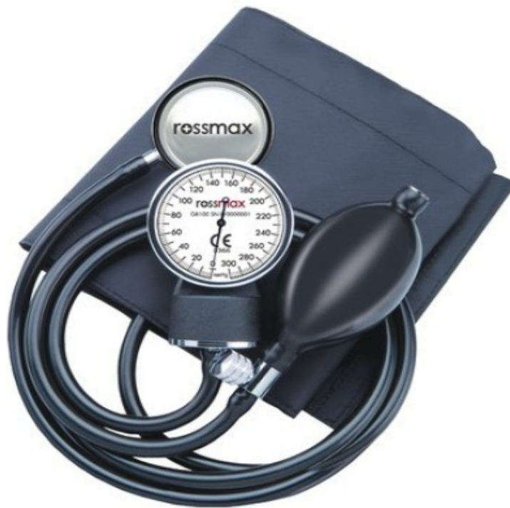
Slika 2. Tlakomjer s manometrom na pero.

Tlakomjer s manometrom na pero u današnje vrijeme je adekvatna zamjena za živin tlakomjer (slika 2). Visoke je kvalitete i preciznosti, a lakši je i jednostavniji za prenošenje od živinog tlakomjera. Ovaj tlakomjer ima osjetljiv i kompliciran mehanizam te zahtjeva redovito kalibriranje jednom godišnje. Tlakomjer na pero je osjetljiv na udarce te ga je potrebno kalibrirati nakon pada ili ako se njime udari o nešto.