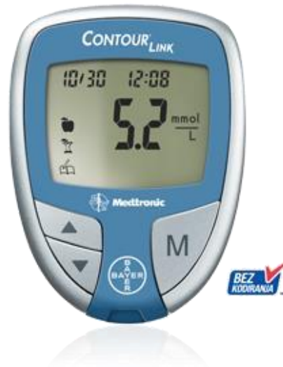
Slika 2. Glukometar(24)