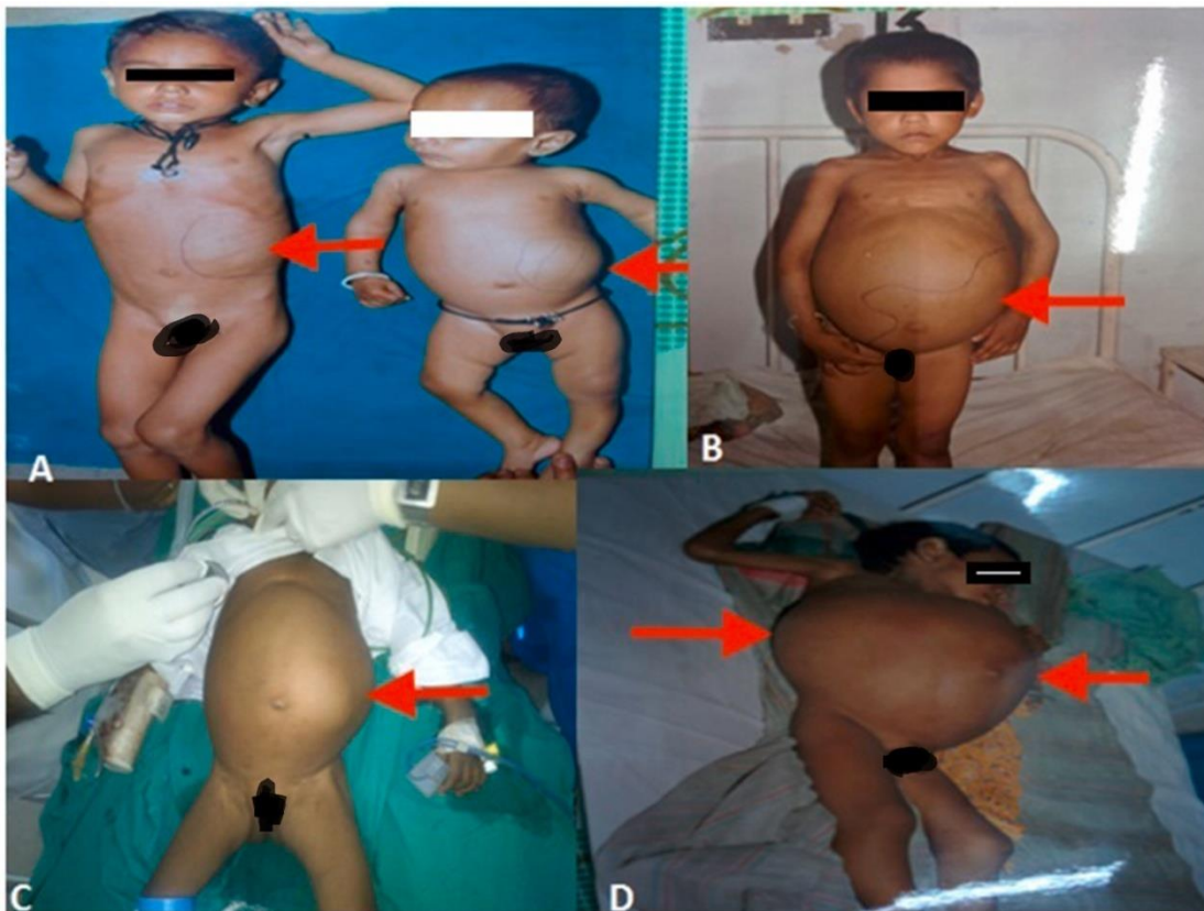
Slika 1. Prikaz izgleda trbuha kod djece sa Wilmsovim tumorom.

Obilježje malignih bolesti jest nekontrolirana dioba tumorski promijenjenih stanica. Iz početnog mjesta nastanka primarnog tumora, zloćudni se tumori prenose krvlju, limfom ili migracijom stanica u okolna tkiva ili u udaljene organe tvoreći metastaze. Na mjestu rasta bolesti novotvorina i stanice mijenjaju zdravo tkivo, organi gube svoju prvobitnu strukturu i narušavaju bolesnikov život. Bolest dugo prolazi podmuklo i bez simptoma. Pojava prvih simptoma i znakova bolesti je najčešće nespecifična: umor, nemoć, nedostatak apetita i pad tjelesne težine. Simptomatologija s obzirom na dječju dob, rast i razvoj često puta bude zanemarena. Klinička slika tumora u dječjoj dobi je specifična, oboljeno dijete ima značajno velik i bolan trbuh (Slika 1.), prisutna je hematurija, hipertenzija, hiperkalcemiju, povišena tjelesna temperatura nejasna uzroka i gubitak na tjelesnoj težini.