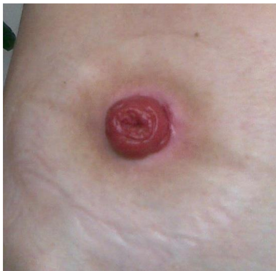
Slika 4.2. Završna ileostoma (8)

Dva su osnovna tipa ileostome: završna (krajnja, trajna ileostoma) i bipolarna (rezom podijeljena na dva dijela, loop ileostoma, privremena ileostoma) (19). Loop ileostoma se najčešće koristi kao privremeno rješenje za eliminaciju stolice kako bi se zaštitila distalna anastomoza (anastomoza debelog crijeva kod parcijalne resekcije debelog crijeva) i spriječio prolaz stolice kroz spoj dvaju krajeva crijeva. Postavlja se tako da se distalna petlja ileuma izvuče iznad površine kože s dva lumena koji se dreniraju u stoma vrećicu (19). Nakon što distalna anastomoza zacijeli, što najčešće traje u razdoblju od tri do šest mjeseci, oba kraka loop ileostome mogu se ponovno spojiti, čime se uspostavlja kontinuitet GI trakta, što omogućuje prolaz stolice u debelo crijevo. Kod loop ileostome, proksimalni ud je onaj koji izbacuje stolicu, a distalni ima ulogu mukozne fistule koja drenira sekret proizveden unutar sluznice iz lumena u cekum. Distalni ud ne drenira izlučevine debelog crijeva ako je ileocekalni zalistak kompetentan, što može uzrokovati nakupljanje sekreta i nadutosti i povećava rizik od perforacije debelog crijeva u slučaju opstrukcije. Završna ileostoma (Slika 4.2.) se postavlja kada je uklonjeno debelo crijevo i ostaje formirana do kraja života (8).