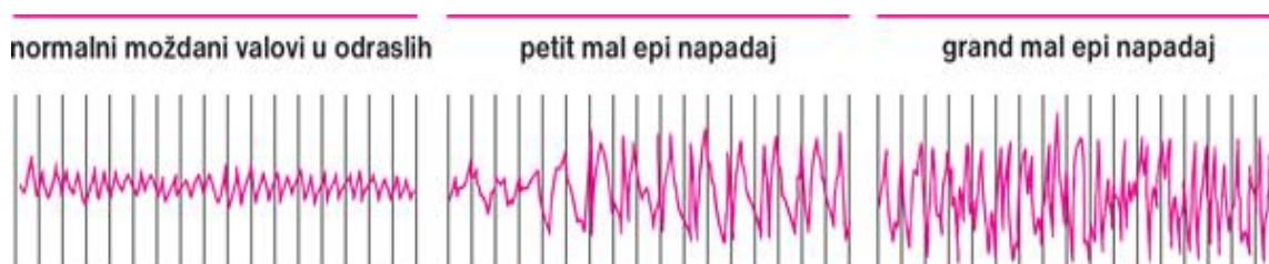
Slika 4.2. Elektroencefalogram (20)