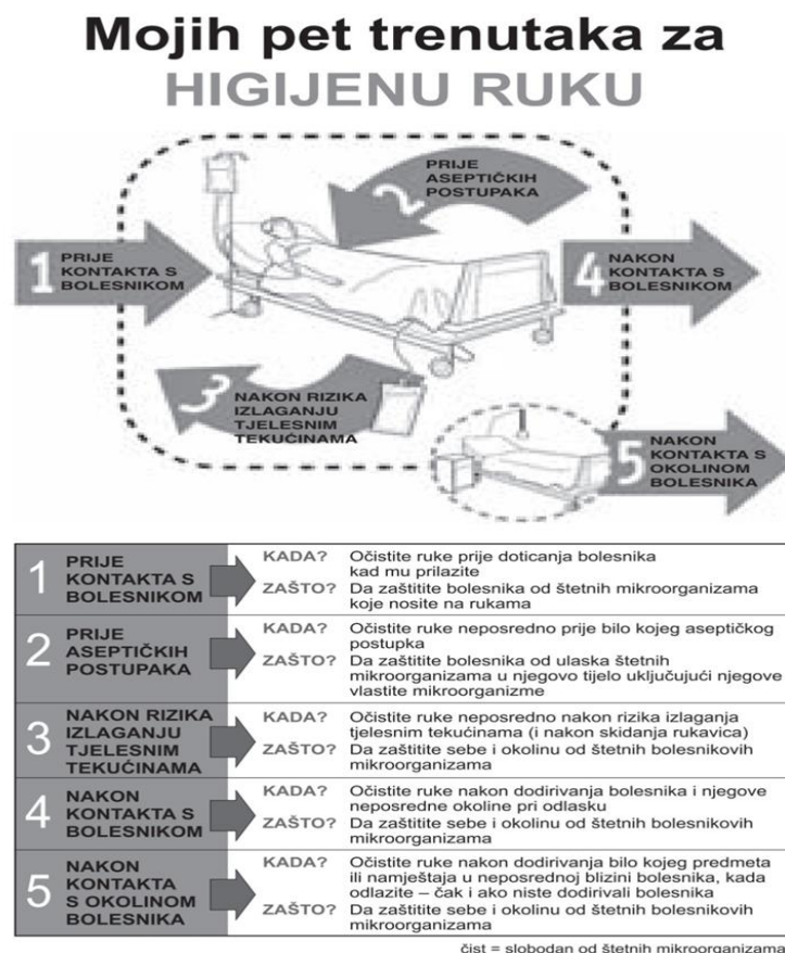
Slika 4.4. „Mojih pet trenutaka za higijenu ruku“ (18)

prevenciju i kontrolu bolesti (engl. Centers for Disease Control and Prevention, CDC ), koje su opisane pod nazivom „Mojih pet koraka za higijenu ruku“ (18) i prikazane su na slici 4.4.