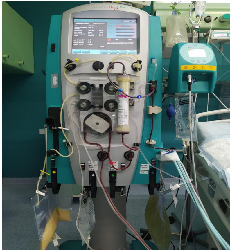
Slika 4.2. Aparat za plazmaferezu

i crvenih krvnih zrnaca krvi. Zamjenska tekućina (albumin i/ili svježe smrznuta plazma) ponovno se kombinira s krvlju i vraća bolesniku. Ova se tehnika provodi korištenjem aparata za plazmaferezu (2, 7). Aparat je prikazan na slici 4.2.