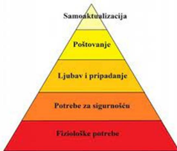
Slika 4.2. Maslowljeva piramida potreba (50)

su urođene svakom pojedincu. Osnovne potrebe moraju se zadovoljiti da bi se moglo postići zadovoljavanje potreba na višim razinama piramide potreba, poput samopoštovanja i samoaktualizacije. Fiziološke i sigurnosne potrebe predstavljaju osnovu za provedbu sestrinske skrbi i sestrinskih intervencija, što ih čini okvirom za postizanje fizičkog i mentalnog zdravlja i dobrobiti (47, 50). Maslowljeva piramida potreba prikazana je na slici 4.2.