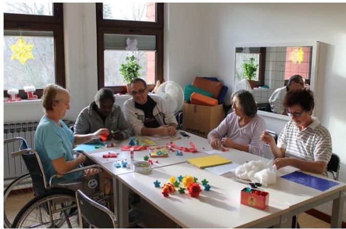
Slika 7.1. Radna terapija [20]

poboljšati interpersonalne odnose i komunikaciju. Dogovara se individualno s bolesnikom u odnosu na njegovo zdravstveno stanje i želje [18,19].