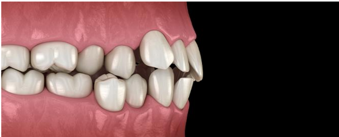
Slika 1. Krivi zagriz i nepravilan položaj zubi

loše oralne higijene i ne poznavanja iste. Karijes kod djece zahvaća mliječne zube koji su važni, no slabi i krhki, pri čemu je mogućnost širenja ove infekcije ozbiljna. Ortodontski problemi najčešće kao pojavni oblik imaju „prenatrpance“ zube, odnosno kada zubi rastu jedan ispred ili jedan preko drugoga ili nisu pravilno poravnati. Nepravilno izrasli zubi uzrokuju nepravilnim zagrizom čeljusti, koji je najčešće najvidljivija naznaka potrebe za ortodontskom terapijom. U slučaju ortodontskih problema djeca trebaju osim zubara, posjetiti i ortodonta, koji će ih uputiti u korištenje i nošenje mobilnog ili fiksnog aparatića za ispravljanje zubi. Kada djeci pravilno rastu zdravi zubi, ona neće imati poteškoće u govoru koje kasnije mogu prerasti u ozbiljnije govorne dijagnoze, moći će pravilno žvakati i razvijati zube i usnu šupljinu. Po ovom pitanju škola također može i mora djelovati, tako da potiče preventivne mjere i programe dentalnih pregleda organiziranjem grupnih pregleda u školama, organiziranjem edukativnih aktivnosti kojima se djecu uči o pravilnoj higijeni zubi, održavanju higijene, te kada je potrebno potražiti pomoć (6).