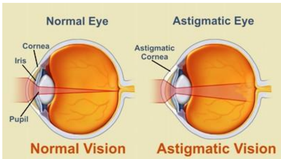
Slika 4. Izgled oka sa astigmatizmom

Simptomi astigmatizma, i kod djece i kod odraslih, jesu zapravo zamućeni vid, osjetljivost na svjetlost, naprezanje očiju, umor, glavobolja, iskrivljena slika, dupli vid i ostali. Nažalost, djeca najčešće uopće nisu svjesna da imaju očnih problema, a kamoli da im je rožnica nepravilno zakrivljena i da imaju astigmatizam ili neki drugi od poremećaja refrakcije. Stoga je od izrazite važnosti i u ovoj situaciji, provoditi česte preglede, bili to sistematski, screening ili samo očni pregledi (11,12).