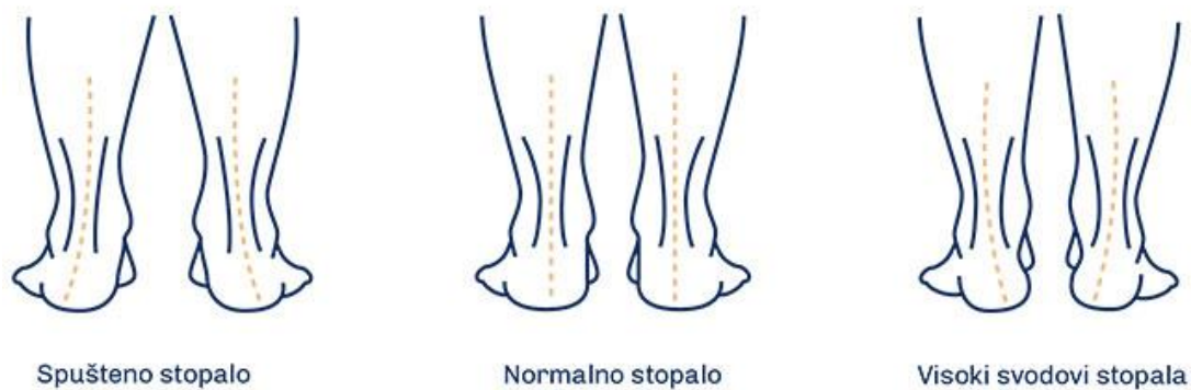
Slika 5. Vrste položaja stopala

Da dijete ima spuštено stopalo, učitelji, medicinske sestre, roditelji i ostali mogu primijetiti po izgledu stopala. Ukoliko djetetova unutarnja strana stopala stoji gotovo potpuno priljubljeno uz pod, velike su šanse da dijete pati od ove dijagnoze. Postoje naravno i odgovarajući testovi kojima se problemi spuštenih stopala mogu ranije uočiti, a također se provode na screening pregledima školaraca (13).