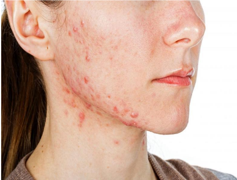
Slika 3. Mladenačke akne