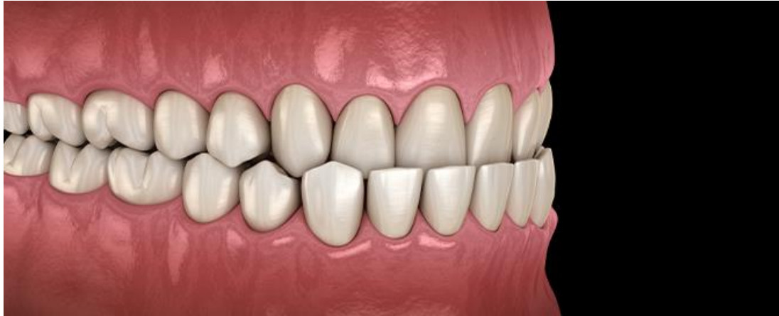
Slika 2. Pravilan zagriz i pravilan položaj zubi