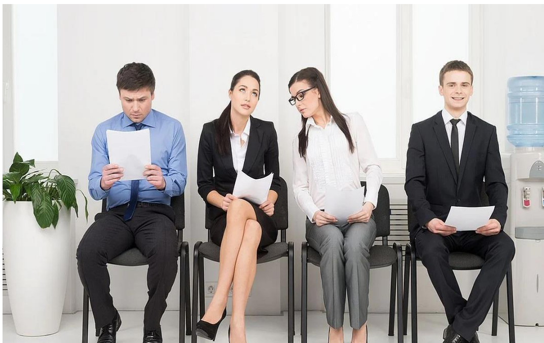
Slika 3.2.2. Položaj tijela kod neverbalne komunikacije

Razlikujemo tri glavne vrste gesta: adapteri, amblemi i ilustratori. Adapteri ponašanja su pokreti koji ukazuju na unutarnja stanja koja su povezana s uzbuđenjem ili anksioznošću i mogu se usmjeriti na sebe, druge ili predmete. Amblemi su geste koji imaju određeno, dogovoreno značenje. Ilustratori su najčešća vrsta geste koja se koristi za ilustraciju verbalne poruke koju prate. Na primjer, gestama ruku možete objasniti veličinu objekta ili problema (8)(slika 3.2.3.) .