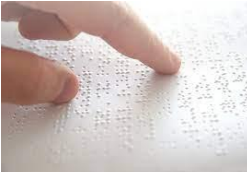
Slika 5.1.1. Braillovo pismo

Oštećenje vida nije bolest. Slijepa osoba, kao i svaka druga osoba koja zbog bolesti zatreba liječničku pomoć mora se najaviti (naručiti) kod svog liječnika telefonski i dogovoriti termin za pregled u ordinaciji. U slučaju hitnog stanja potrebno je doći što prije u najbližu zdravstvenu ustanovu, bez najave ili pozvati hitnu medicinsku pomoć. Slijepa osoba može doći u zdravstvenu ustanovu bez pratnje, može se koristiti pomagalima za samostalno kretanje, dugim bijelim štapom ili psom vodičem slijepih (17). Medicinska sestra ili tehničar najčešće su prvi kojima se osoba obraća u zdravstvenoj ustanovi. Vrlo je važno da oni svoju komunikaciju prilagode potrebama osobe s oštećenjem vida (3). Načini komunikacije s gluhoslijepim osobama svode se na poznavanje i učenje hrvatskih znakovnih jezika te pripadnih specifičnih abeceda. Razlikujemo taktilni, locirani i vođeni hrvatski znakovni jezik, taktilnu dvoručnu i jednoručnu abecedu, prstovnu abecedu i Braillovo pismo (17) (slika 5.1.1.).