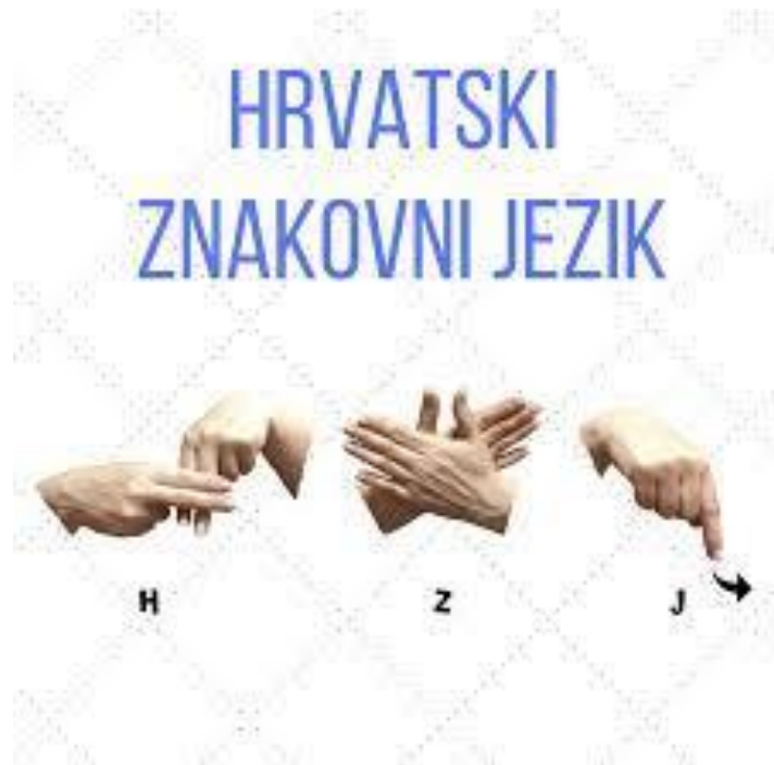
Slika 6.1.1. Hrvatski znakovni jezik

“Čitanje s usana jedna je od metoda komuniciranja, ali ne smatra se pouzdanom obzirom da se uglavnom svodi na pogađanje izgovorenog prema obliku usana i izrazu lica sugovornika.” Obzirom da neke riječi izgledaju jednako izgovoreno, sugovornik često pogađa što je osoba htjela reći na osnovu konteksta. Da bi čitanje s usana bilo što preciznije preporuča se govoriti sporije, ne prenaglašavati pokrete usana, praviti stanke, isticati teme razgovora (23).