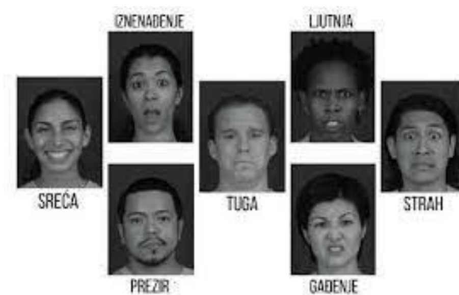
Slika 3.2.1. Izraz lica kod neverbalne komunikacije

Izraz lica je najizražajniji dio našeg tijela. Lice reagira odmah i teško se mogu sakriti emocije prikazane u datom trenutku. Osnovne skupine izraza lica su sreća, tuga, strah, bijes i gađenje. Lice i oči glavne su točke fokusa tijekom komunikacije. Određene kretnje očiju povezujemo s osobinama ličnosti ili emocionalnim stanjima. Kontakt očima i pogled vrlo su moćni neverbalni znakovi (8) (slika 3.2.1).