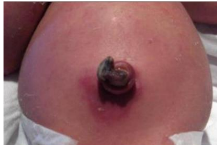
Slika 4.2. Infekcija pupčanog batrljka kod tetanusa

C. tetani je anaerobna, saprofitna, gram - pozitivna bakterija te ima sposobnost proizvodnje toksina. Stvara spore koje se ne mogu eliminirati iz okoliša i mogu izdržati ekstremne temperaturene uvjete u unutarnjim i vanjskim okruženjima. Dobro je poznato da spore tetanusa mogu preživjeti u okolišu dugi niz godina i često su otporne na toplinu i dezinficijense. Izvor infekcije kod većine ljudi je rana. U drugima se tetanus može razviti od opekline, apscesa nakon kirurškog zahvata, intravenske zlouporabe droga ili gangrene. U mnogim slučajevima bolesnici imaju nepotpunu imunizaciju ili nisu cijepljeni. Kod većine ljudi imunitet od cjevica protiv tetanusa opada s godinama. Stoga je za prevenciju potrebno cijepljenje ili docjepljivanje. Neonatalni tetanus često nastaje posljedica poroda kod kuće prilikom nehigijenskog rezanja pupčane vrpce.