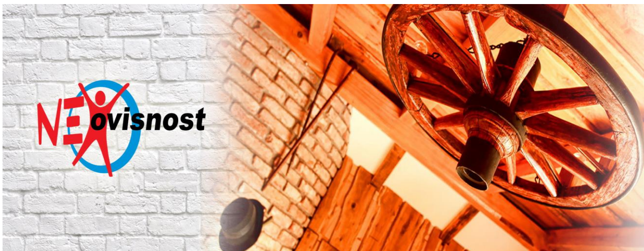
Slika 4.7. Udruga Ne-ovisnosti Dostupno na: https://ne-ovisnost.hr/ (12.06.2022.)

Udruga Providnost osnovana je 2011. godine, a osnovali su je liječeni ovisnici koji su završili program liječenja terapijskoj zajednici „Cenacolo“. Svrha djelovanja Udruge direktno je usmjerena na pružanje svih oblika pomoći i potpore, ovisnicima u pripremi za zajednicu, liječenim ovisnicima po izlasku iz zajednice i mladima sklonim rizičnim oblicima ponašanja, zajedno sa njihovim obiteljima, a s glavnim ciljem liječenja ovisnosti, sprječavanja razvoja bolesti i održavanja apstinencije. „Aktivnosti udruge jesu: