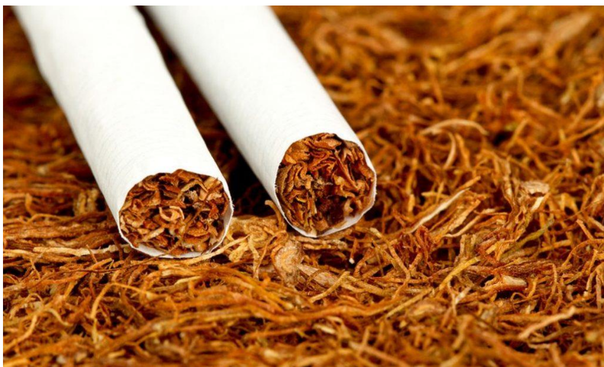
Slika 4.4. Prikaz duhana za konzumiranje Dostupno na: https://www.tdu.hr/duhani/ (12.06.2022.)

malignih i drugih bolesti s obzirom na štetnost udisaja dima iz cigarete. Prema procjenama SZO-a, u svijetu ima jedna milijarda i tri stotine milijuna pušača. Istraživanja su pokazala da 80 i 100 tisuća djece u svijetu u dobi od 13 do 15 godina puši. U svijetu jedna od deset osoba umre od posljedice pušenja, pa tako više ljudi umire od posljedice pušenja nego od posljedica prometnih nesreća, alkohola, požara, ubojstava, samoubojstava i AIDS-a zajedno. Nikotinomanija je bolest ovisnosti o pušenju duhana. Svjetska zdravstvena organizacija procjenjuje da su 90-95 % ljudi umrlih od raka pluća bili pušači, a kod smrtnosti od ostalih vrsta raka pušača je do 50 %. U smrtnostima od kronične opstruktivne bolesti pluća, emfizema i bronhitisa pušači sudjeluju sa 75-80 %, a kod srčano žilnih bolesti s 20-25 %.