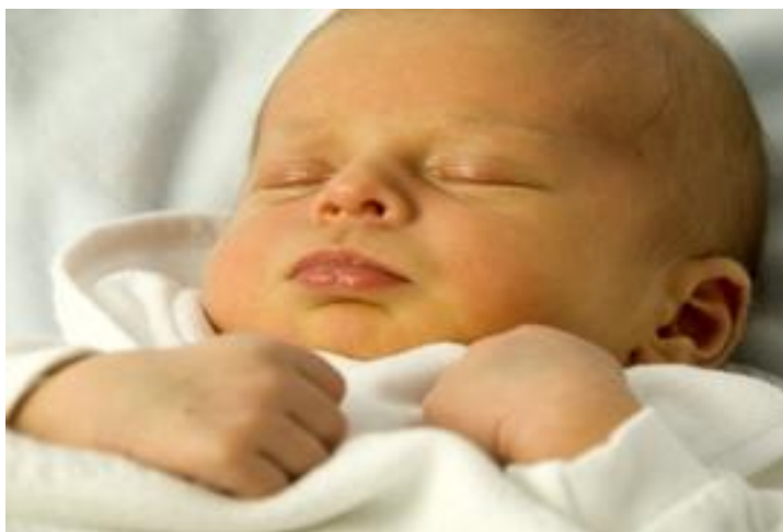
Slika 2. Žutica kod novorođenčeta [32].