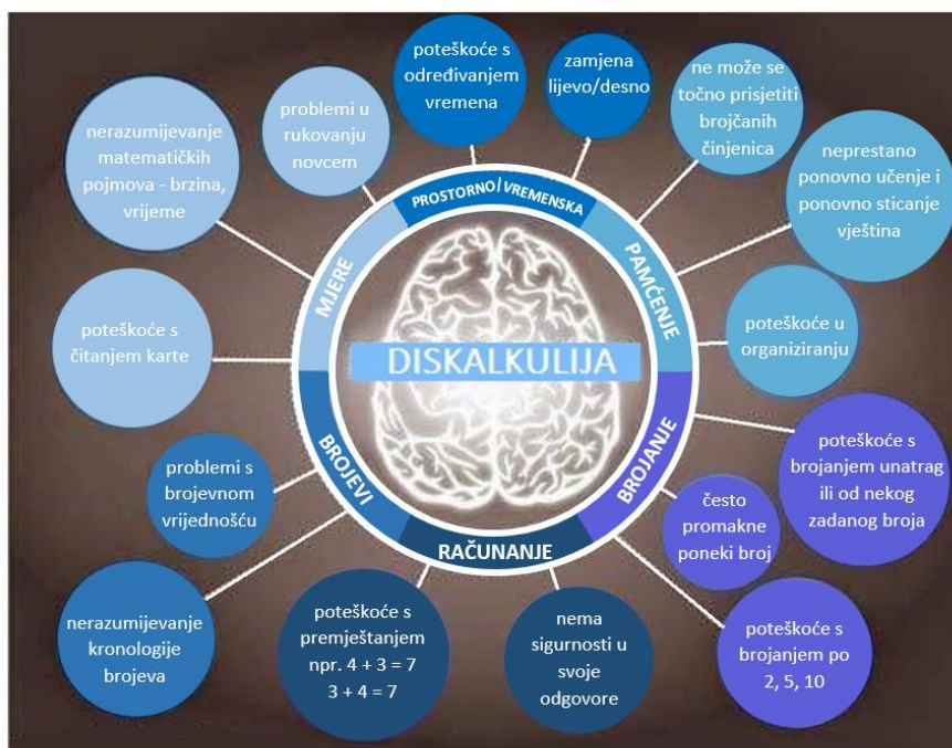
Slika 3.3 Teškoće djeteta sa diskalkulijom u svakodnevnom životu