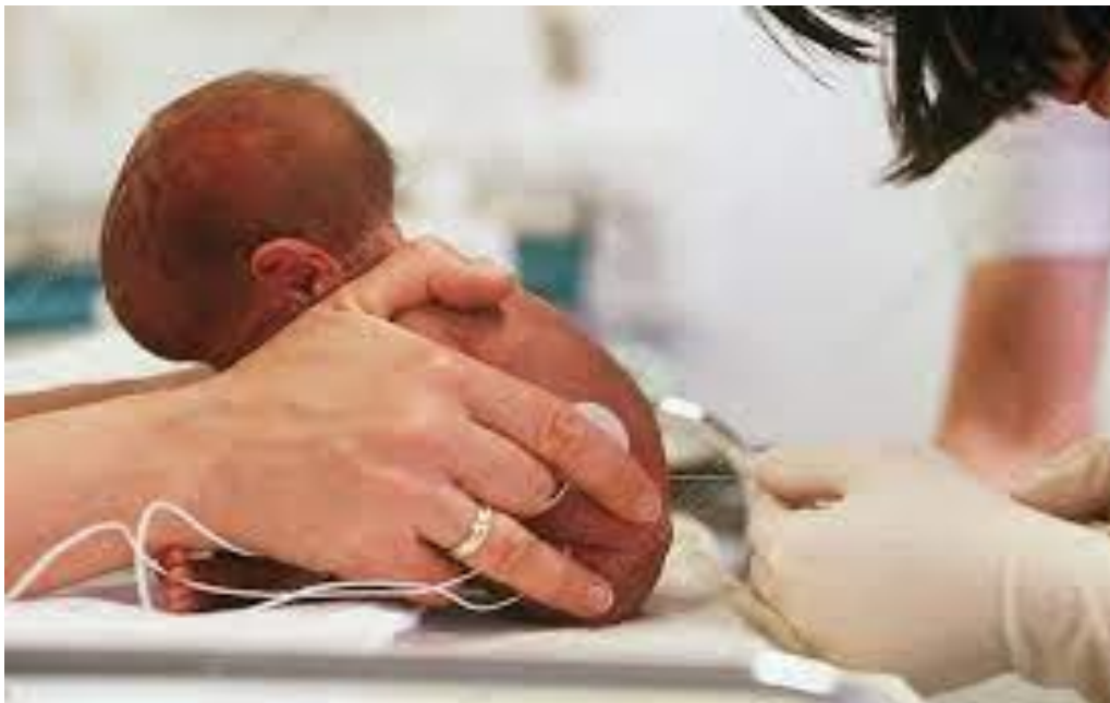
Slika 2. Položaj djeteta kod lumbalne punkcije – sjedeći

Dijete je za vrijeme provedbe postupka LP-e potrebno staviti u odgovarajući položaj, sjedeći ili ležeći bočni (Slika 2 i 3). Svrha ovih položaja je što bolja fleksija same kralježnice, kako bi se omogućio lakši pristup intervertebralnom prostoru u području L3-L4 slabinskih kralješaka. Uz to, mora se paziti da se ne učini prevelika fleksija glave i vrata te time ugrozi dišni put djeteta (4,16).