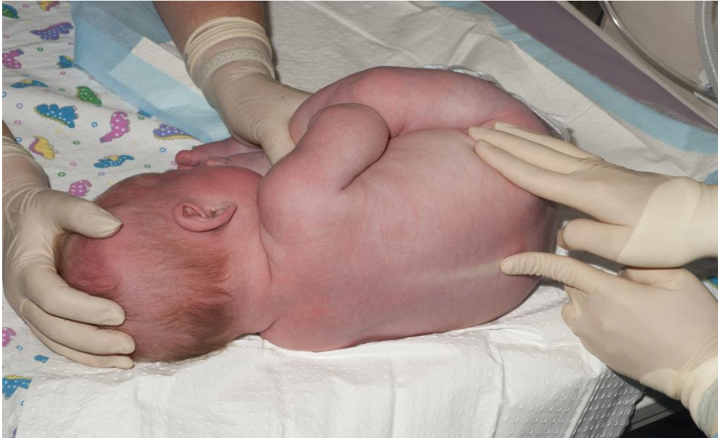
Slika 3. Položaj djeteta kod lumbalne punkcije – ležeći bočni