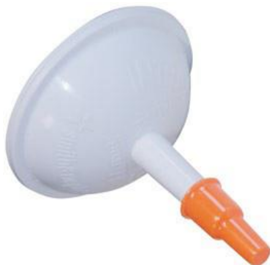
Slika 3. Hidrogel za hidrogelne obloge