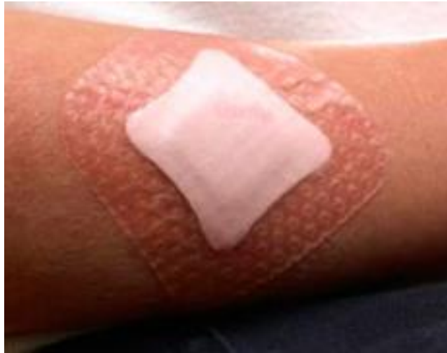
Slika 6. Obloga sa silikonom - ljepljiva