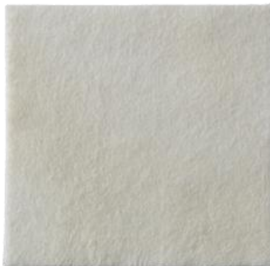
Slika 4. Alginat