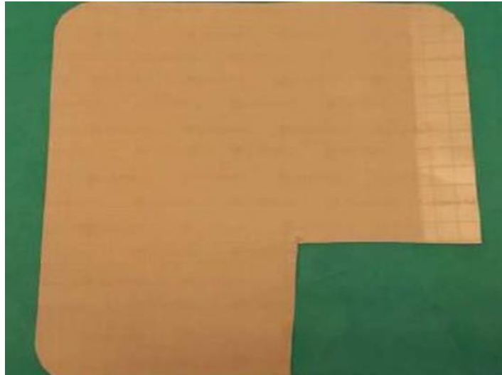
Slika 2. Hidrokolidni oblog za kronične rane