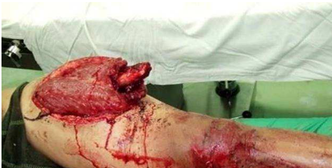
Slika 1: Vanjski prijelom bedrene kosti