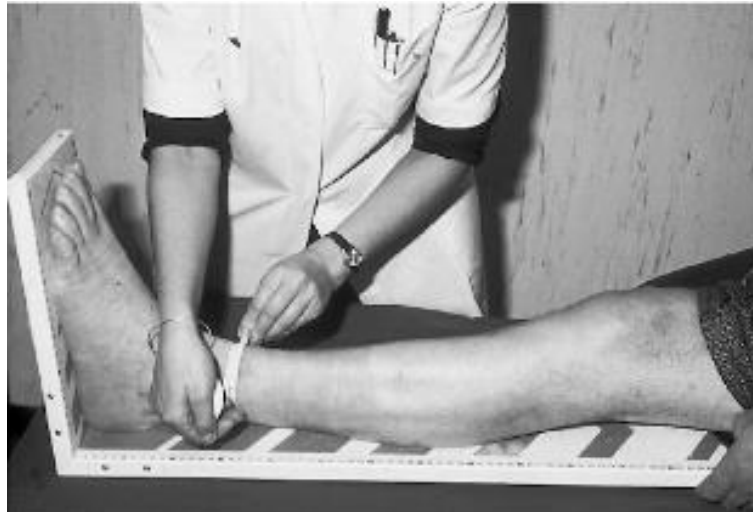
Slika 4.2.3.3 Uzimanje mjera za određivanje dimenzije i vrste kompresivne čarape

Izvor: Elsner P, Hatch K. Textiles and the skin. Basel: Karger; 2003.