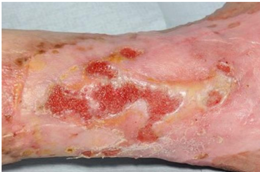
Slika 1.2.1.2 Granulacija na dnu venskog ulkusa