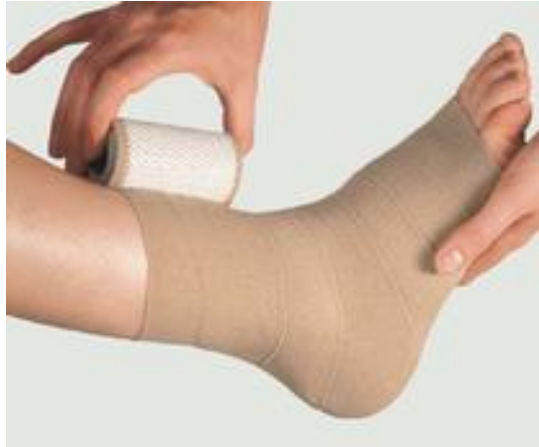
Slika 4.2.1.1 Kratko-elastični kompresivni zavoj