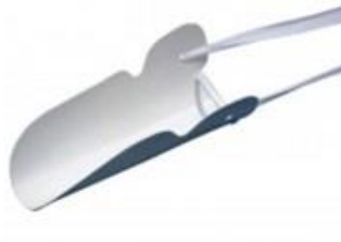
Slika 4.2.3.6 Pomagalo za oblačenje kompresivnih čarapa sa pamučnim vrpčama