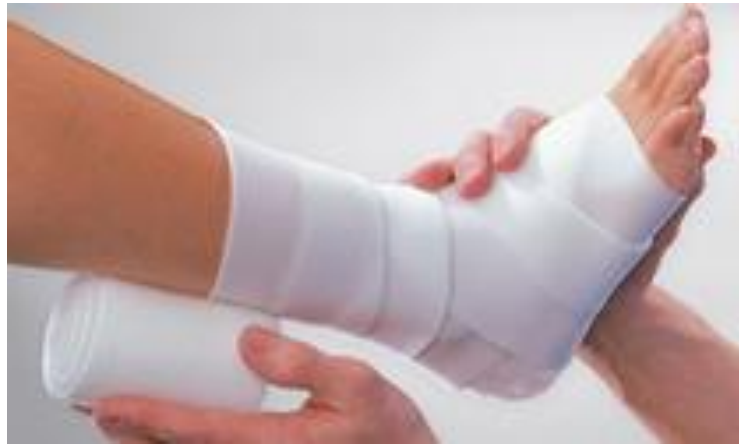
Slika 4.2.2.1 Dugo-elastični kompresivni zavoj

Zavoj se postavlja direktno na kožu, no ako je na nozi ulkus koji ima jaku sekreciju, preporuča se preko osnovne obloge postaviti pamučni krep zavoj pa preko toga dugoelastični zavoj kako bi se kompresivni zavoj što više zaštitio od potencijalnog curenja sekreta. Uloga krep zavoja je zaštita dugoelastičnog zavoja i on ne radi nikakvu kompresiju. Dugoelastični kompresivni zavoj je potrebno skidati navečer ili prije dužeg mirovanja jer može doći do boli u nozi uzrokovanom kompresijom arterija i posljedičnom ishemijom. Nakon odmaranja potrebno je zavoj opet postaviti i to prije početka aktivnosti ili kretanja (12).