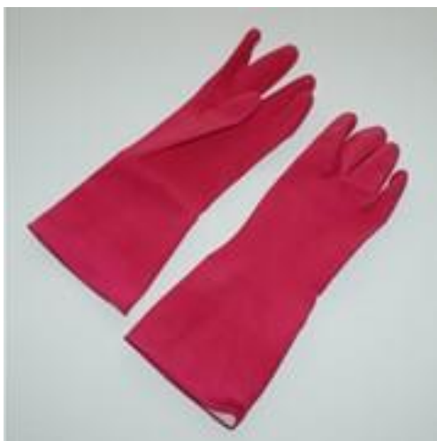
Slika 4.2.3.4. Gumene rukavice za lakše oblačenje kompresivnih čarapa