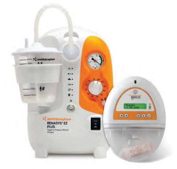
Slika 5.1.4.1 Aparat za terapiju negativnim tlakom

i do potpunog zatvaranja rane. Kontraindicirana je kod rana sa nekrotičnim naslagama i krustama. Aparat za primjenu tlaka (prikazano na slici 5.1.4.1) povlači sekret s površine rane u spremnik, a osim spremnika sastoji se od pumpe, drenažne cjevčice, obloge za ranu od antimikrobne gaze te ljepljive folije koja spaja površinu obloge s drenažnom cijevi (16).