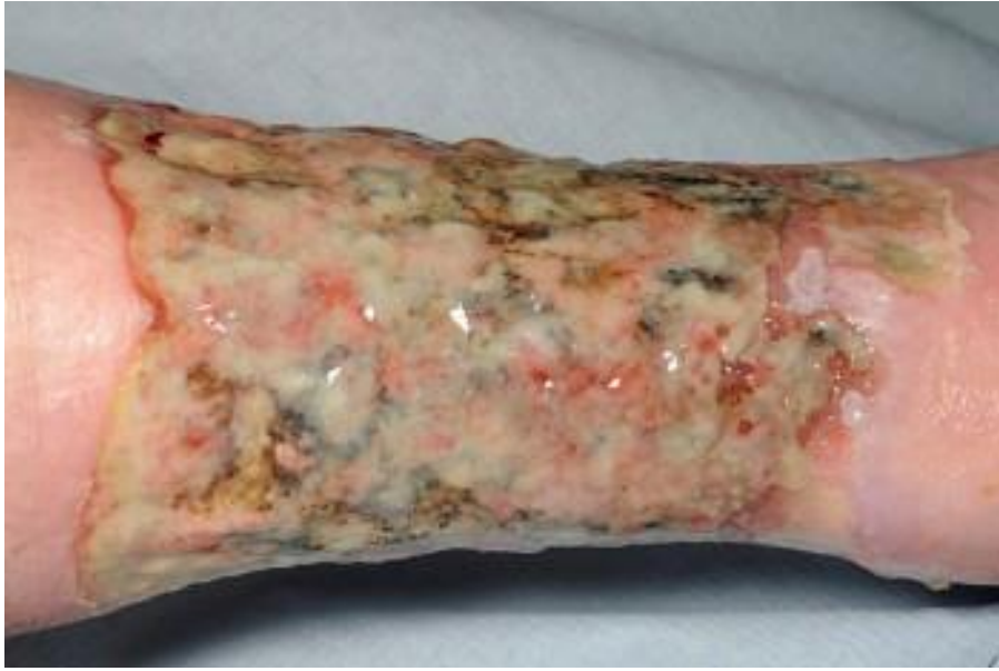
Slika 1.2.1.1 Infekcija rane venskog ulkusa