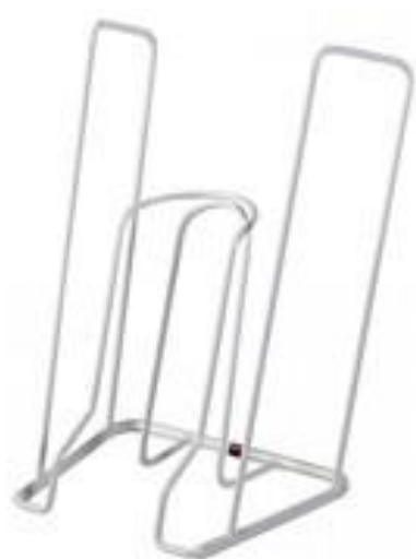
Slika 4.2.3.5 Pomagalo za oblačenje kompresivnih čarapa