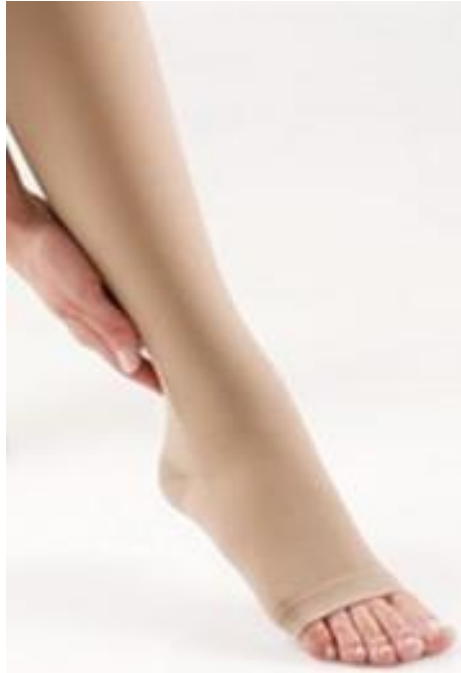
Slika 4.2.3.1 Kompresivna čarapa

Česta je pogreška da se jače stegne mjesto gdje je proširenje vena najjače izraženo u odnosu na distalniji dio, što može samo štetiti. Treba zabraniti razne podvezice i gume za pridržavanje čarapa koje pritišću vene i pridonose zastoju. Preporuča se stupnjevita kompresija jačine 20 – 40 mmHg za gležanj, 16 mmHg za list, te 8 mmHg za bedro (13).