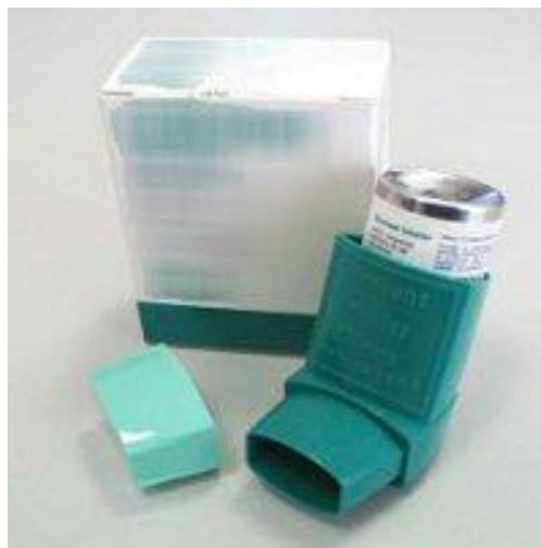
Slika 2. Pumpica ili sprej

Najčešće propisivan raspršivač. Aktivacija raspršivača oslobađa fiksnu količinu lijeka. Prednost mu je mogućnost uporabe većine lijekova za astmu, dok mu je glavna mana usklađenost aktivacije raspršivača i početka udisaja (Slika 2) (13).