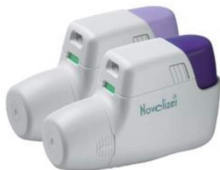
Slika 6 . Novolizer®