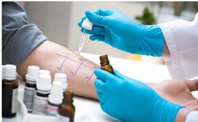
Slika 1. Prick kožni test

U slučaju postojanja mastocita senzibiliziranih specifičnim IgE protiv primjenjenog alergena, nastaje pozitivna reakcija. Pozitivna se reakcija očituje pojavom urtike promjera najmanje 5 mm uz okolno crvenilo, 15 minuta poslije primjene alergena. Urtika dosegne maksimum za tridesetak minuta i zatim polako nestane. Kod nekih ispitanika s jakom reaktivnošću edem i crvenilo se pojačavaju 6-8 sati, uz prisutan svrbež i pečenje, a zatim do 24 sata od primjene sve nestane. Ova kasna reakcija upućuje na jači stupanj alergijske senzibilizacije. Na temelju pozitivne reakcije kožnog alergološkog testiranja izvode se pokusi inhalacije osumnjičenog alergena radi provokacije bronhopstrukcije. Međutim, to se rijetko izvodi na djeci jer mogu izazvati jaki napadaj i moguće je primjeniti samo jedan alergen (10).