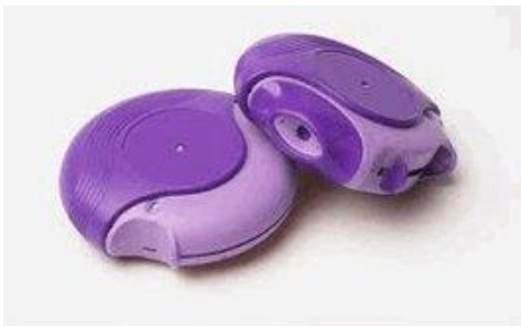
Slika 5. Diskus®

Noviji oblici spremnika s lijekom, za razliku od „pumpica“, nemaju potisni plin. Lijek se nalazi u obliku sitnog praha kojeg treba vlastitom snagom udaha unijeti u pluća. Upotreba Diskusa® (Slika 5) i Novolizera® (Slika 6) uvelike olakšavaju primjenu terapije uz istovremeno točnije doziranje samog lijeka (25).