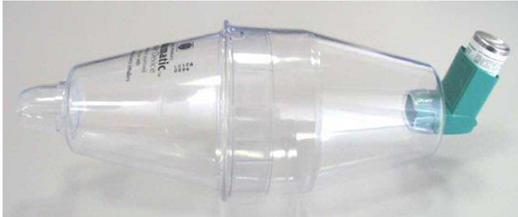
Slika 4. Volumatic®