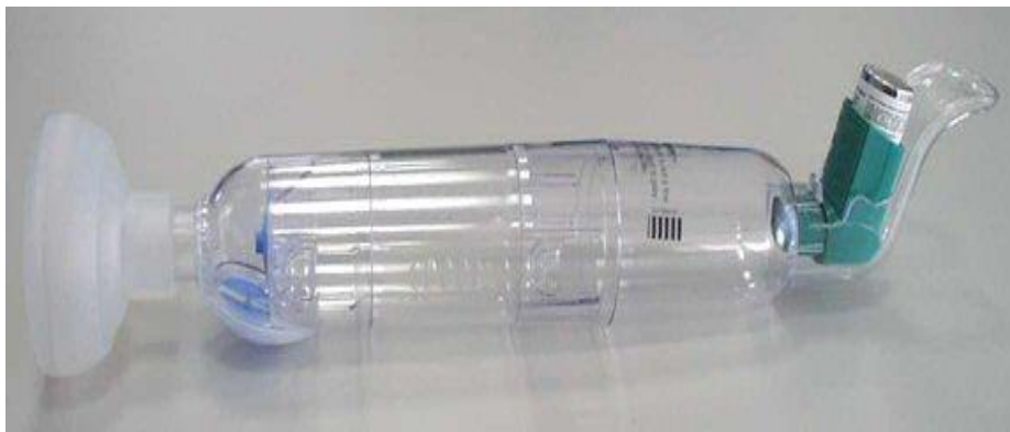
Slika 3. Babyhaler®